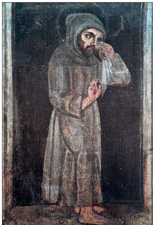
Vjerodostojan lik sv. Franje Asiškog. Franjevački samostan Isusovih jaslaca, Greccio, Italija

Franjo Asiški (1182.–1260.), utemeljitelj najbrojnijega kršćanskog reda franjevaca i jedan od najimpresivnijih ličnosti u povijesti Crkve. S povijesnomedicinskog motrišta, u njegovu je životu presudan bio događaj vezan za trošnu crkvu Sv. Damjana u rodnome Assisiju gdje je najprije pomogao gubavom prosjaku, a zatim obnovio crkvu koja će poslije postati matičnom kućom franjevačkih redovnica “siromašnih klarisa” koje je utemeljila sv. Klara. Nakon toga Franjo nastavlja obnavljati staru napuštenu