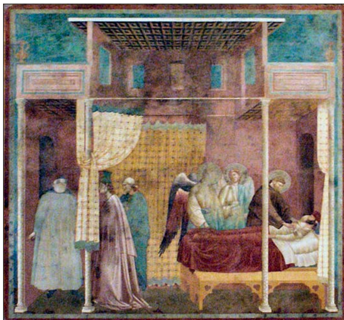
Giotto di Bondone(1267.–1337.): Liječenje čovjeka iz Ilerde. Iz ciklusa legenda o životu sv. Franje u gornjoj crkvi Sv. Franje u Assisiju.

Giotto di Bondone(1267–1337). The curing of a man from Ilerda. Saint Francis cycle in the Upper Church of San Francesco at Assisi.