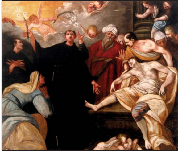
Nepoznati slikar, XVIII. st. Čudo s odsječenom nogom. Iz ciklusa Čudesa sv. Antona Padovanskog, crkva Sv. Jurja, Buzet

Anonymous, 18 th century. Miracle with a severed leg. From Miracles Performed by St Anthony of Padua, the Church of St George, Buzet (Croatia).