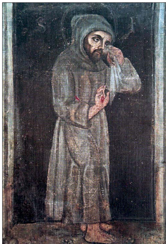
Vjerodostojan lik sv. Franje Asiškog. Franjevački samostan Isusovih jaslaca, Greccio, Italija

Franjo Asiški (1182.–1260.), utemeljitelj najbrojnijega kršćanskog reda franjevaca i jedan od najimpresivnijih ličnosti u povijesti Crkve. S povijesnomedicinskog motrišta, u njegovu je životu presudan bio događaj vezan za trošnu crkvu Sv. Damjana u rodnome Assisiju gdje je najprije pomogao gubavom prosjaku, a zatim obnovio crkvu koja će poslije postati matičnom kućom franjevačkih redovnica “siromašnih klarisa” koje je utemeljila sv. Klara. Nakon toga Franjo nastavlja obnavljati staru napuštenu