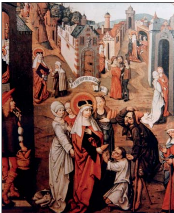
Sv. Elizabeta Ugarska dijeli kruh siromasima i bogaljima. Slika nepoznatog autora iz XV. st., Muzej Wallraf, Köln

Ruža Viterbska (1234.–1252.). Prema legendi, već od treće godine uz nju se vežu neobjašnjivi događaji uz koje je često doživljavala neobična viđenja. U ranoj mladosti pristupa trećoretkama sv. Franje, a zatim se povlači u samostan i uskoro umire u osamnaestoj godini. Prema predaji, nakon njezine smrti u gradu i okolici dogodilo se više čuda i čudesnih ozdravljenja koja su joj pripisana. Za zaštitnicu od pelagre izabrana je nakon što je čudom ozdravila od neke “teške bolesti s kožnim promjenama” nalik na pelagru, a što je zapravo bila posljedica isposničkoga gladovanja.