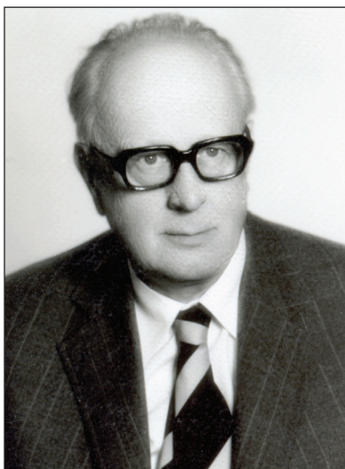
Prof. dr. Stjepan Urban (1907.–1989.)

Stjepan Urban rodio se 23. studenoga 1907. godine u Zagrebu. Otac mu je bio mali državni službenik koji je umro dok su mu bile tri godine. Majka udovica postavila je na noge starijeg brata i njega. U Zagrebu je završio sve škole. Maturirao je na Klasičnoj gimnaziji 1926. godine. Studirao je botaniku i zoologiju (pod A), povijest filozofije, logiku i psihologiju (pod B) i fiziku (pod C) na Filozofskom fakultetu u Zagrebu gdje je i diplomirao 1931. godine. Još kao student postao je demonstrator u Botaničkom zavodu. Nakon postignute diplome odgađao je službu u vojsci dok nije završio započetu disertaciju iz biljne citologije (disertacija je rađena pod mentorstvom akademika prof. dr. Vale Vouka). U to je vrijeme objavio i svoj prvi znanstveni rad (1933.). Nakon odsluženja vojnog roka postao je volonter asistent na Botaničkom zavodu kod prof. dr. Vouka (1934.). Godine 1936. bio je promaknut na čast doktora filozofije na osnovi tiskane disertacije O razvoju plastida i o citosomima . Iste je godine prešao iz Botaničkog zavoda Filozofskog fakulteta u Zavod za botaniku Poljoprivredno-šumarskog fakulteta u Zagrebu.