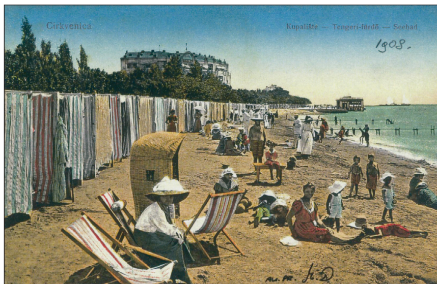
Slika 2. Pješčano kupalište – Plaže i hotel Miramar

Nagli razvoj turizma potaknuo je brojne crikveničke iseljenike iz čitavog svijeta, kao i pečalbare, da svoj teško stečeni novac ulože u Crikvenici u izgradnju kuća i vila za iznajmljivanje soba strancima i turistima. Štoviše, Ivan Skomerža st., vrlo napredni ribar i dobrostojeći trgovac,