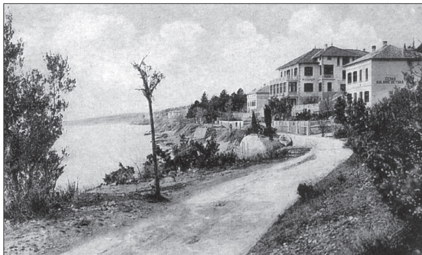
Slika 5. Češka kolonija

Zavaljujući upornosti i marljivosti Čehinja Marije Steyskalove i njezine pomoćnice i nasljednice Berte Drgačove, u Crikvenici se 1909. osniva čehoslovačko dječje oporavilište Česka detska ozdravny Marie Steyskalove .