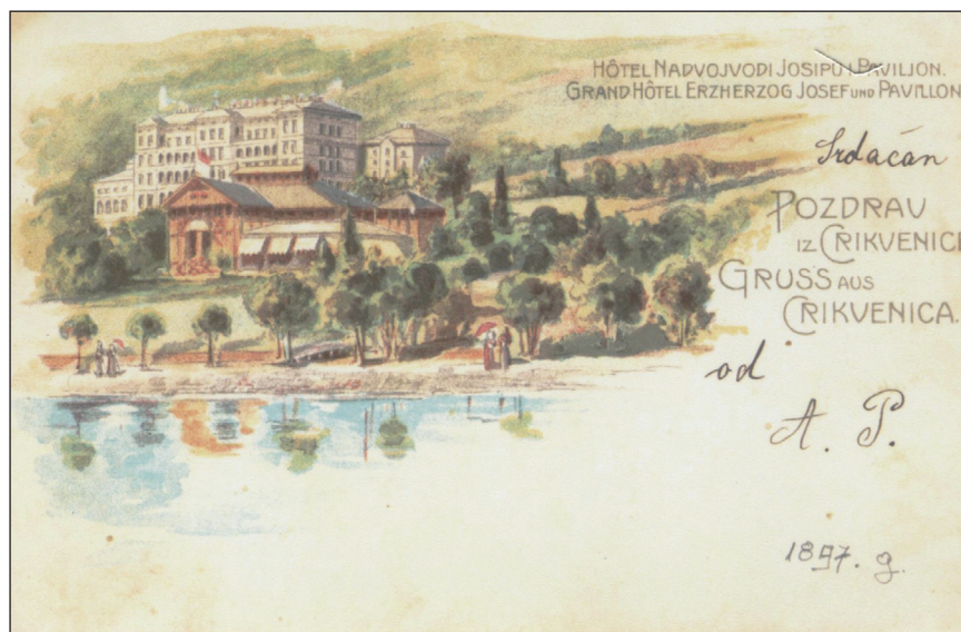
Slika 1. Hotel nadvojvode Josipa i paviljon