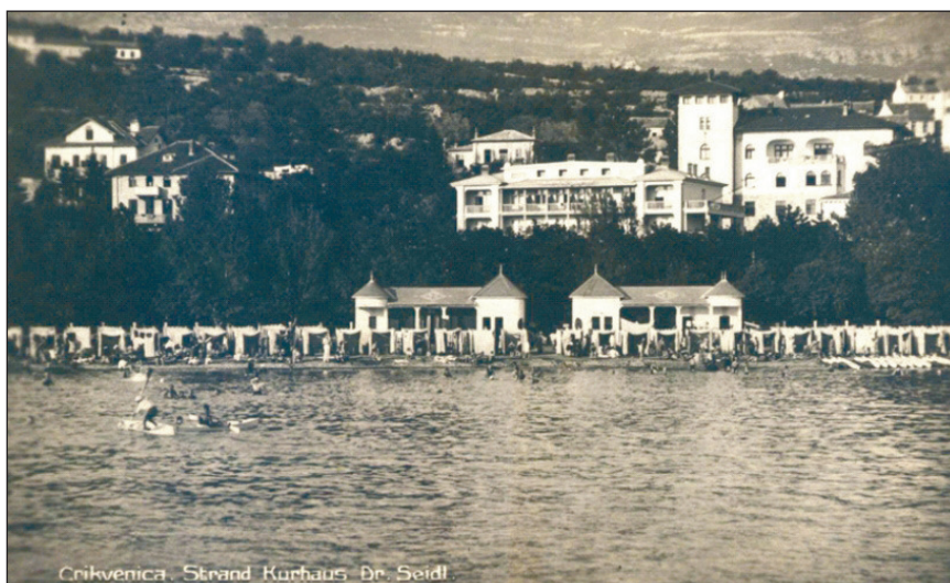
Slika 4. Dom Dr. Oskar Seidl Figure 4 Dr Oskar Seidl's Home

nadvojvotkinja Clotilda preuređuje u Ladislavov dječji dom (Laszlo Gyermekötthon – Ladislaus Kinderheim – Ospicio marino) prema imenu njihova nesretno, u lovu, poginula sina [2,3,10]. Tu su se od 14. travnja 1898. liječila i oporavljala djeca iz čitave države. Kupalište doma uređeno je prema Kneippovu sistemu [3]. Poslije, tj. nakon Prvoga svjetskog rata, to je bio Dječji dom kojem je od 1919. do 1931. ravnatelj bio Vladimir Nazor [1,6,7,10].