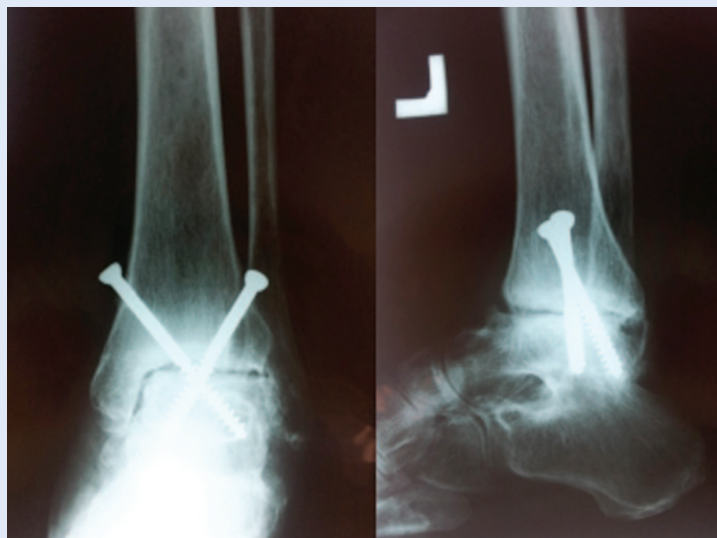
Slika 1. RTG snimke artroskopske artrodeze gležnja uz primjenu unutarnje fiksacije vijcima

Postoperacijski bolesnik je imobiliziran dokoljetnom longetom uz hod s dvije štake s potpunim rasterećenjem noge kroz dva tjedna. Zatim se na-