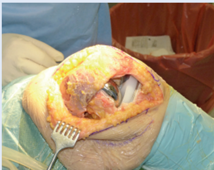
Slika 3. Ugrađena totalna endoproteza koljena, hvatište VMO-a u potpunosti očuvano

Ugradnja totalne endoproteze koljena minimalno invazivnim subvastus pristupom dokazano je pouzdana, učinkovita i sad već standardna operacija u ortopediji. Prednost subvastus pristupa jest u tome što jednostavnim „produženjem” kožnog reza i medijalnom parapatelarnom incizijom možemo operaciju nastaviti standardnim, medijalnim parapatelarnim pristupom, ako tijekom zahvata primijetimo da je ovim pristupom nemoguće ugraditi endoprotezu.