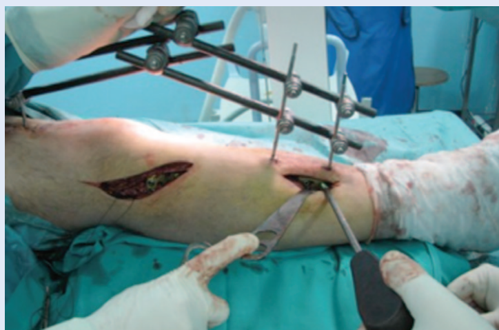
Slika 7. MIPO nakon vanjske fiksacije prijeloma proksimalne tibije Definitivna fiksacija prijeloma proksimalne tibije tehnikom MIPO nakon inicijalne stabilizacije prijeloma privremenim vanjskim fiksatorom.

Prijelomi distalnog dijela tibije, gdje su repozicija i fiksacija IM implantatima tehnički zahtjevnije 25 , a kožni pokrov oskudan i opterećen komplikacijama u cijeljenju rane, danas se relativno često zbrinjavaju tehnikom MIPO (slika 9) koja je opisana krajem 20 stoljeća 65 . Tehnika MIPO može osigurati dobar ishod liječenja s niskom učestalosti infekcija i odgođenog cijeljenja 14,25,66 uz dobre funkcionalne rezultate 66 . Postotak infekcija u literaturi varira od 4 % 67 do 19 % 14 , ovisno o tipu prijeloma. Iako u eksperimentalnom modelu prijeloma distalne tibije IM implantati pokazuju veću čvrstoću od LCP ploče, konstrukcija postignuta LCP pločom dovoljno je stabilna da osigura koštano cijeljenje 68 .