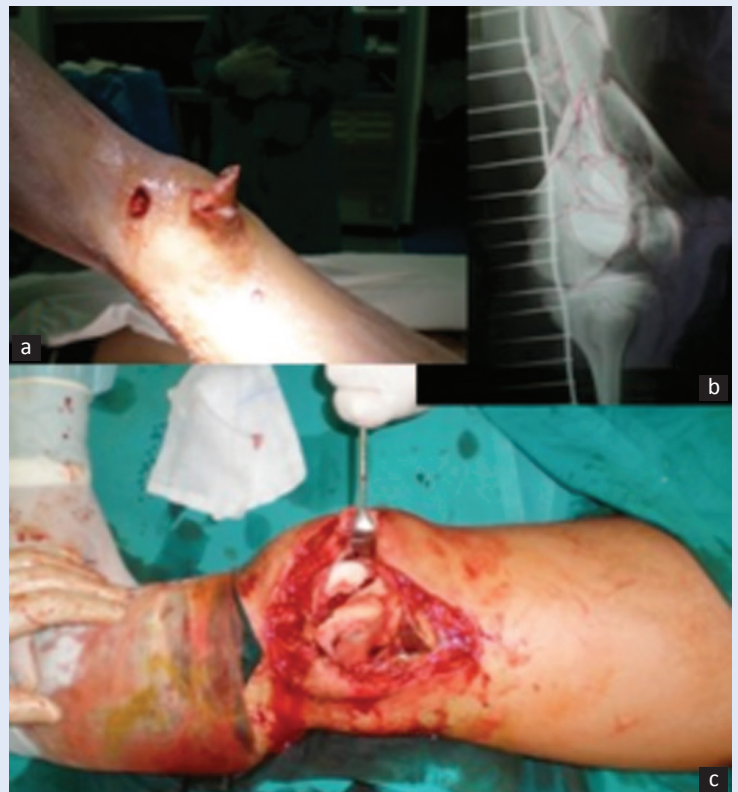
Slika 5. Otvoreni kominutivni intraartikularni prijelom distalnog femura a) Otvoreni kominutivni prijelom distalnog femura, tip IIIA po Gustilo-Andersonovoj klasifikaciji; b) RTG snimka i prijeoperacijska analiza tipa prijeloma; c) Distalna incizija nakon debridmana inicijalne rane s prikazom intraartikularnih fragmenata radi anatomske repozicije i fiksacije zglobnih tijela.

de i širu primjenu 55-60 . Kompleksni prijelomi s artikularnom i metafizno-dijafiznom komponentom predstavljaju idealnu indikaciju za upotrebu anatomske LCP ploče (slika 5 i 6). Princip osteosinteze uključuje repoziciju fiksaciju artikularnih fragmenata po principu apsolutne stabilnosti kroz artrotomiju (čija veličina ovisi o tipu prijeloma) i nakon fiksacije artikularnog bloka s pločom nastavlja se sa zatvorenom repozicijom i fiksacijom ploče kroz proksimalnu inciziju izvan zone prijeloma 11,58,60,61 . Na anatomskim studijama dokazano