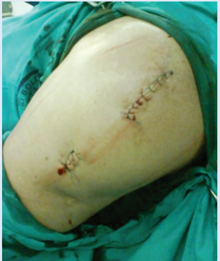
Slika 4. Pristup na proksimalni humerus Incizija nakon minimalno invazivnog pristupa na proksimalni humerus. Figure 4 Approach to proximal humerus Incision after minimally invasive approach to proximal humerus.

Rezultati liječenja prijeloma u području prijelaza metafize u dijafizu humerusa, ovisno o metodi i implantatu za stabilizaciju, različiti su i imaju relativno visoku učestalost sekundarnog pomaka s gubitkom stabilnosti i posljedičnim nesraštavanjem prijeloma 36 . Korištenje principa BUF i mo-