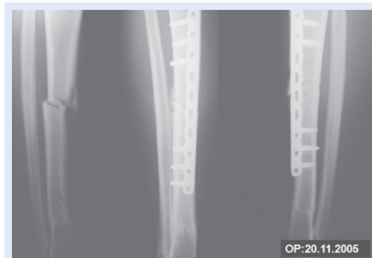
Slika 8. Prijelom dijafize tibije Prijelom dijafize tibije liječen tehnikom MIPO. Distalno je vidljiv deformitet kanala nakon ranijeg prijeloma dijafize.

Figure 7 MIPO after external fixation of proximal tibial fracture Final stabilization of proximal tibial fracture with MIPO after initial stabilization with spanning external fixator.