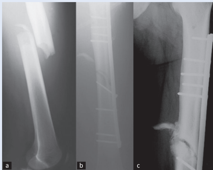
Slika 1. Prijelom dijafize femura.

U začetcima MIPO-a koristili su se stari implanta-ti, ploče s klasičnim vijcima (slika 1 i 2), koji su osiguravali stabilnost trenjem između površine ploče i kosti. Nekroza kosti koja je mogla nastati trenjem između ploče i priležeće kosti s perios-tom ugrožavala je stabilnost zbog postupne resorpcije nekrotične kosti. Nestabilnost nastala zbog resorpcije ugrožavala je cijeljenje kosti i u slučaju pojave radioloških znakova nestabilnosti i bolova zahtijevala je ponovnu kiruršku interven-ciju. Proučavanjem procesa koštane nekroze uo-