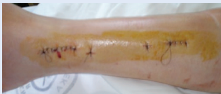
Slika 9. Cijeljenje operacijske rane Operacijska rana nakon dva dana od stabilizacije prijeloma distalne tibije tehnikom MIPO.

Široka upotreba u kliničkoj praksi i relativno velik broj objavljenih radova rezultirali su proširenjem indikacija i korištenjem tehnike u stabilizaciji prijeloma potkoljenice nastalih velikom količinom kinetičke energije, uključujući i otvorene prijelome 14-16,66,67 . Kod stabilizacije otvorenih prijeloma tibije neophodno je poštovati staged protocol s inicijalnom vanjskom fiksacijom uz debridman i tretman rane (slika 10), kako bi se osigurao vitalan mekotkivni pokrov 14-16 . U recentnom članku korejskih autora opisan je lateralni pristup za MIPO tibije kod otvorenih prijeloma II do III B stupnja po Gustilo-Andersonovoj klasifikaciji (slika 11). Uz postignute dobre kliničke rezultate evi-