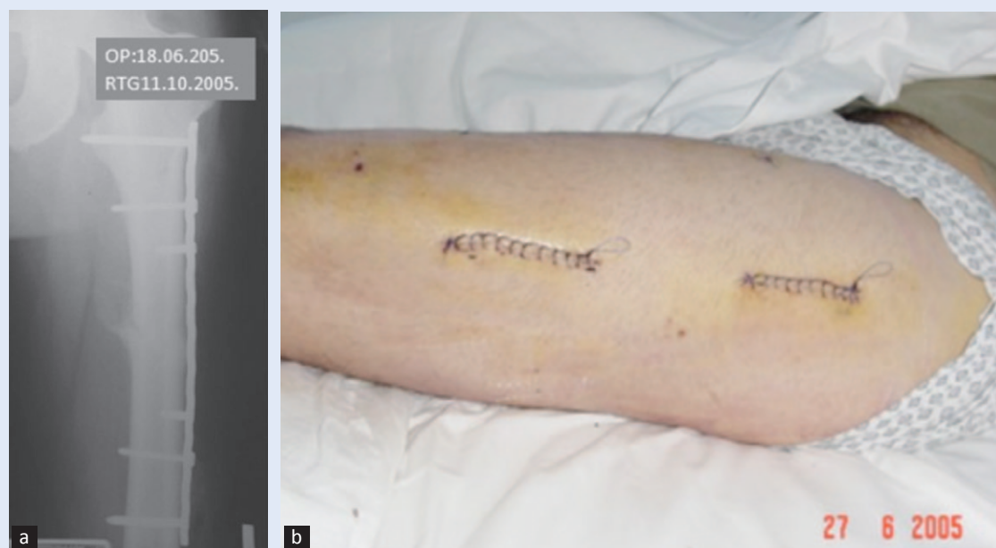
Slika 3. Prijelom dijafize bedrene kosti liječen tehnikom MIPO s LCP (engl. Locking Compression Plate ) pločom. a) Radiogram 15 tjedana nakon operacije: Saniran prijelom bedrene kosti. Bridging princip s minimumom materijala koji osigurava stabilnost. b) Isti bolesnik. Sanacija operacijskih rana, devet dana nakon MIPO-a.

Figure 2 Functional result of femoral shaft fracture The same patient from figure 1. Excellent functional result after healing of femoral shaft fracture, four months from injury.