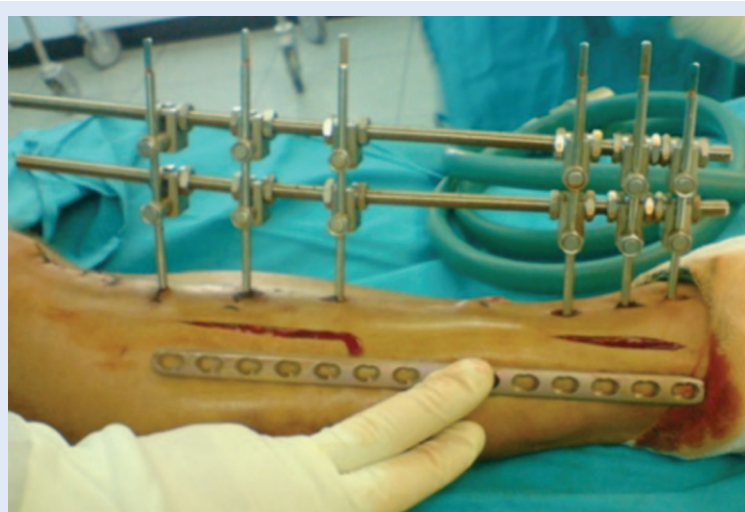
Slika 11. Lateralni pristup na tibiju. Staged protokol i incizija za definitivnu stabilizaciju otvorenog prijeloma distalne tibije tehnikom MIPO kroz lateralni pristup.

a) Stage after initial external fixation of open proximal tibial fracture. b) Rotational skin flap for skin defect reconstruction. c) Wound healing after rotational flap and split skin grafting. d) Uneventful bone healing of fracture treated with MIPO technique trough lateral approach.