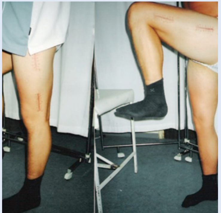
Slika 2. Funkcionalni rezultat nakon prijeloma dijafize femura. Bolesnik sa slike 1. Odličan funkcionalni rezultat liječenja prijeloma dijafize femura, četiri mjeseca nakon ozljede.

Upotreba LISS i LCP ploče značajno je pridonijela širenju tehnike MIPO, jer su navedeni implantati, uz adekvatan instrumentarij, pojednostavili sam operativni postupak. Danas postoje i anatomske oblikovane LCP ploče praktički za svaku kost u tijelu, što kirurgu omogućava da odabere odgovarajući oblik ploče, bez potrebe da se tijekom samog operacijskog zahvata ploča ručno savija i