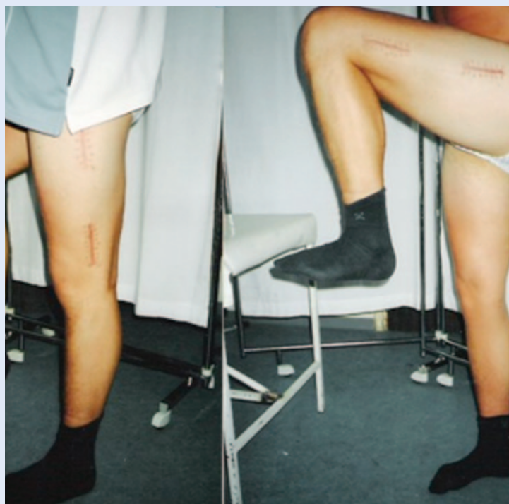
Slika 2. Funkcionalni rezultat nakon prijeloma dijafize femura Bolesnik sa slike 1. Odličan funkcionalni rezultat liječenja prijeloma dijafize femura, četiri mjeseca nakon ozljede.

Upotreba LISS i LCP ploče značajno je pridonijela širenju tehnike MIPO, jer su navedeni implantati, uz adekvatan instrumentarij, pojednostavili sam operativni postupak. Danas postoje i anatomske oblikovane LCP ploče praktički za svaku kost u tijelu, što kirurgu omogućava da odabere odgovarajući oblik ploče, bez potrebe da se tijekom samog operacijskog zahvata ploča ručno savija i