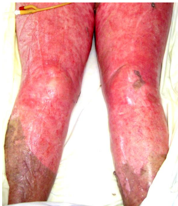
Slika 5. Potpuni gubitak epidermisa kod toksične epidermalne nekrolize.

pozitivan – nakon tangencijalnog mehaničkog pritiska na eritematozne zone dolazi do odvajanja epidermisa od dermisa. Pucanjem bula ostaju velike površine denudiranog dermisa (Slika 5) (3,7). Ostali simptomi uključuju vrućicu, limfadenopatiju, hepatitis i citopeniju (3).