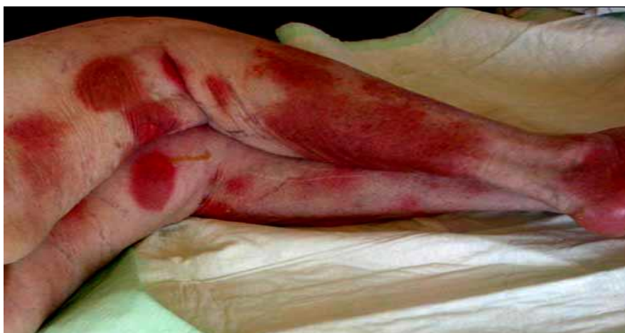
Slika 12. Generalizirana bulozna fiksna erupcija na lijkove.