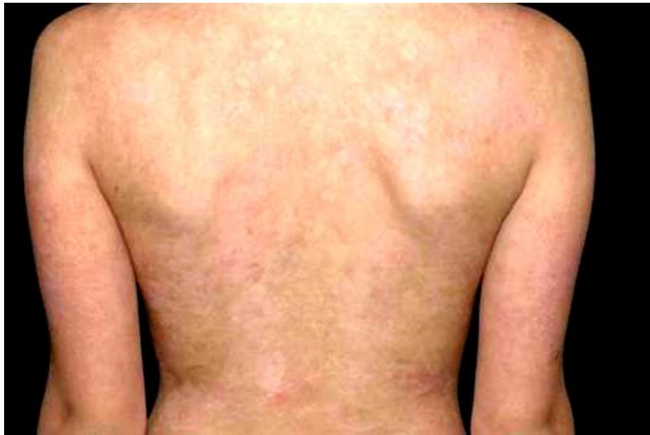
Slika 7. Hipo- i hiperpigmentacije kao posljedica sindroma preklapanja Stevens-Johnsonova sindroma i toksične epidermalne nekrolize.

Više od 50% pacijenata koji prežive TEN ima neki oblik trajnih posljedica bolesti. Simblefaron, konjunktivalne sinehije, entropij, trihijaza, ožiljkavanje kože, promjene u pigmentaciji (Slika 7), eruptivni nevusi, perzistentne erozije sluznica, kserostomija, strikture jednjaka, fimozis, vaginalne sinehije, distrofija nokta i difuzni gubitak kose neke su od tih posljedica (7,29).