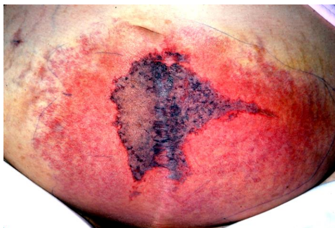
Slika 11. Varfarinom inducirana nekroza kože donjeg dijela trbuha.

odvajanja velikog područja kože i time do teške bolesti (4,38).