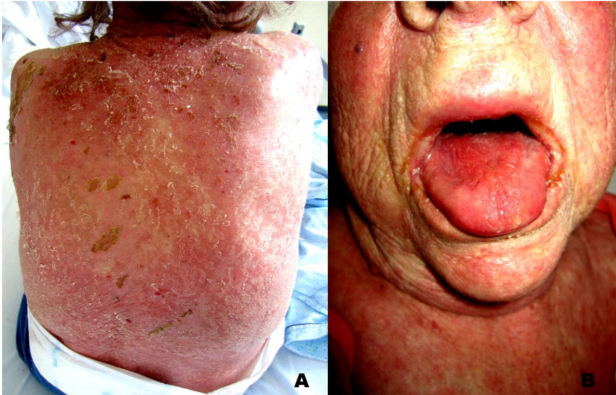
Slika 10. DRESS sindrom. A) Teški ekfolijativni dermatitis (eritrodermija); B) Edem i eritem lica te zahvaćenost sluznice

Ostale kožne manifestacije uključuju vezikule, napete bule, folikularne i nefolikularne pustule, purpuru i ekfolijativnu eritrodermiju (Slika 10 A). Početno zahvaćena mjesta tipično su lice, gornji dio trupa i ekstremiteti. Edem lica je čest nalaz u ovoj bolesti, a ponekad se javi i deskvamacija te zahvaćanje sluznica (Slika 10 B) (2,4).