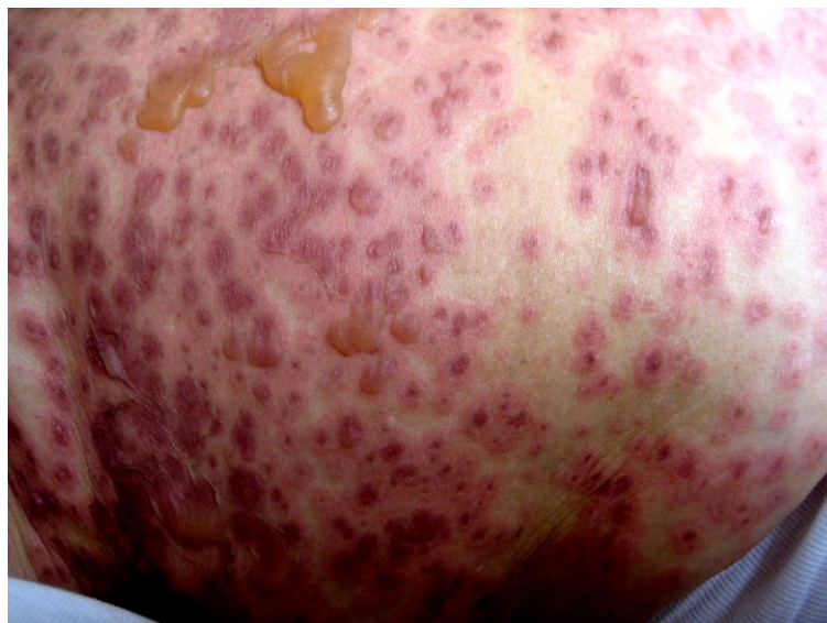
Slika 4. Targetoidne makule i bule u sindromu preklapanja Stevens-Johnsonov sindrom - toksična epidermalna nekroliza.