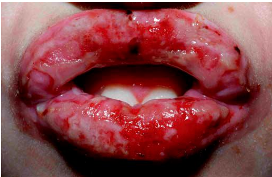
Slika 2. Erozije ustiju i usnica u Stevens-Johnsonovom sindromu.

Izvor: Mockenhaupt M. Severe drug-induced skin reactions: clinical pattern, diagnostics and therapy. J Dtsch Dermatol Ges 2009;7:142-62.