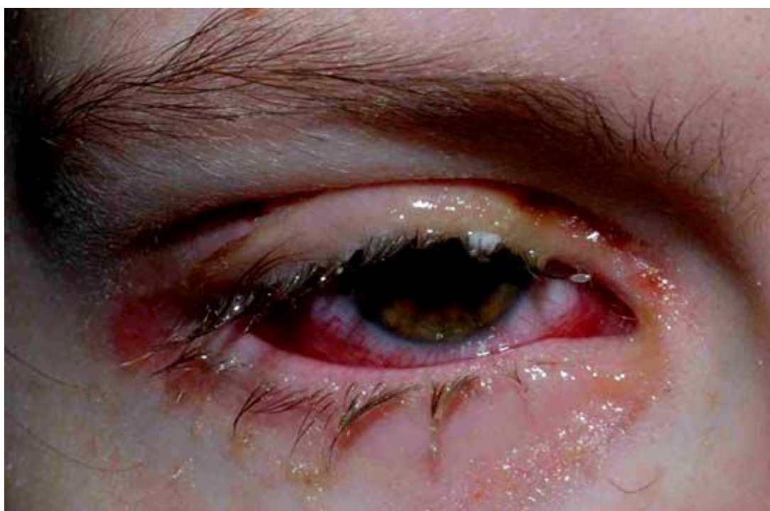
Slika 3. Teška zahvaćenost oka kod Stevens-Johnsonova sindroma i toksične epidermalne nekrolize.