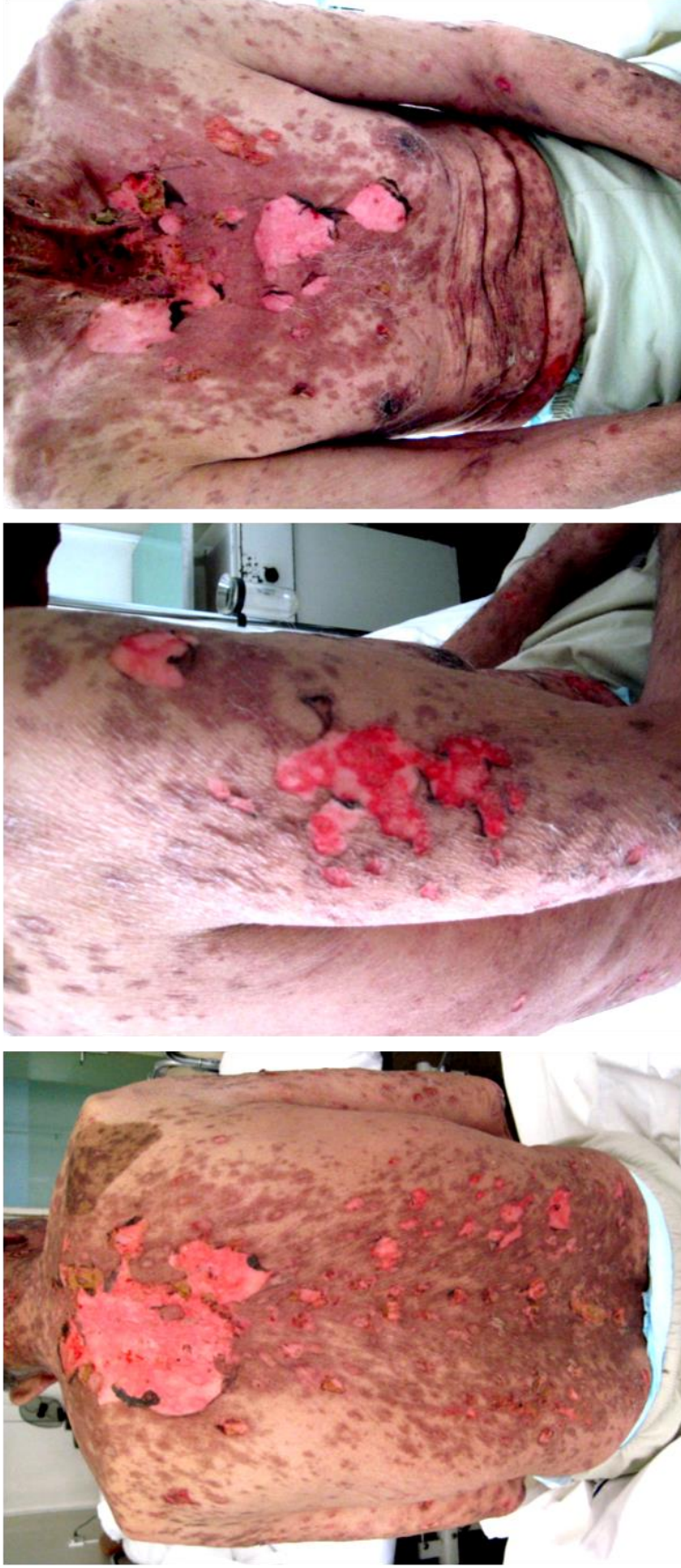
Slika 1. Stevens-Johnsonov sindrom/toksična epidermalna nekroliza – sindrom preklapanja. Na trupu i proksimalnim dijelovima ruku vidljivije su brojne karakteristične zagasito crvene makule s područjima nekroze kože.