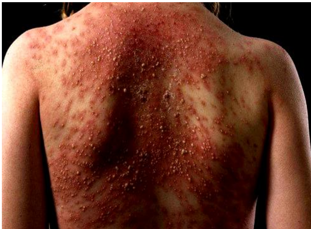
Slika 8. Akutna generalizirana egzantematозна pustuloza. Vidljive su brojne male pustule na eritematoznoj podlozi.