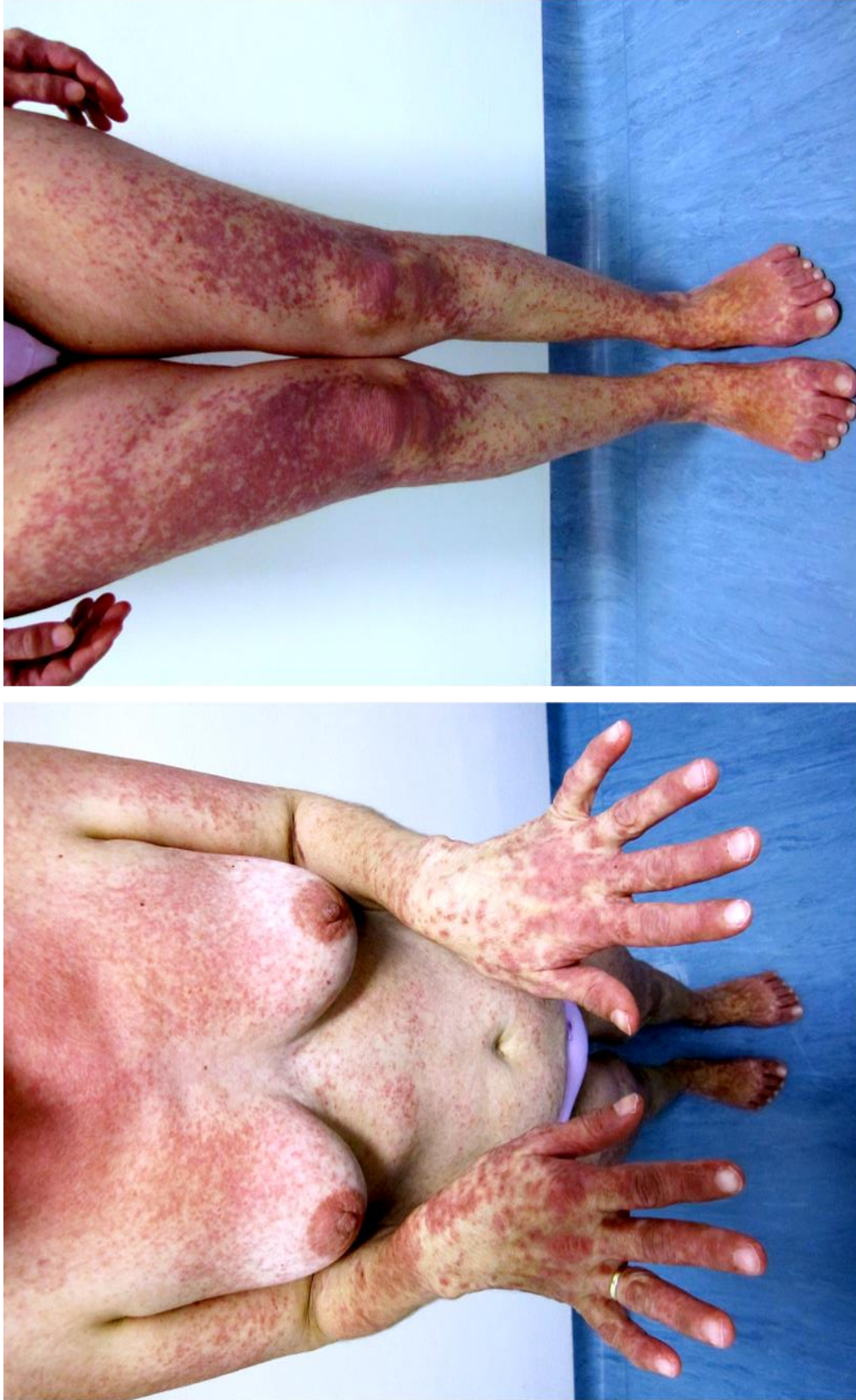
Slika 9. Generalizirani makulopapulozni osip u sklopu DRESS sindroma