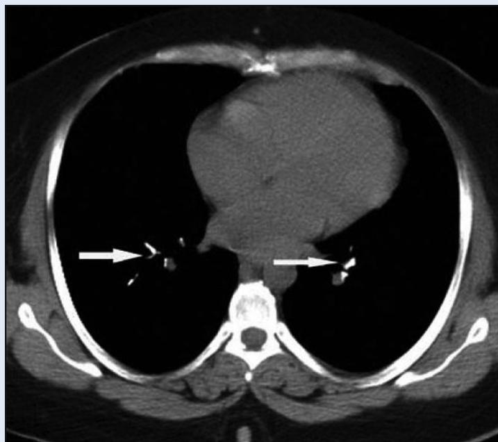
Slika 2. Cementni embolusi u plućnim arterijama, komplikacija zahvata. Figure 2 Embolic material in pulmonary arteries, procedure complication

Skupina bolesnika mlađe dobi, zbog niske incidencije komplikacija i brzog oporavka funkcional-