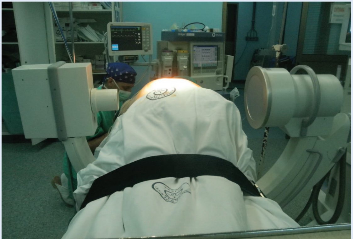
Slika 3. Položaj C-luka u lateralnoj poziciji Figure 3 C-arm in lateral projection