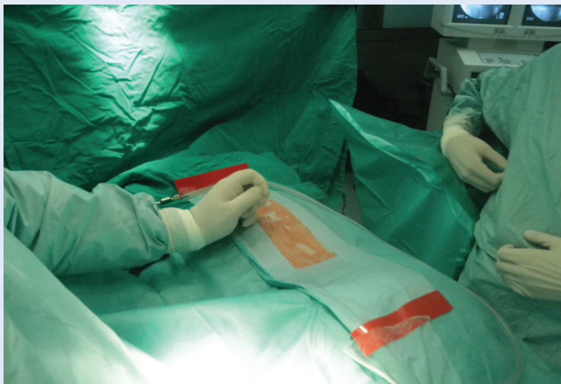
Slika 5. Selektivna blokada korijena živca Figure 5 Selective nerve root injection

Razumijevanje bioloških učinaka ionizirajućeg zračenja ključno je za postizanje minimalnog izlaganja za vrijeme pretrage ili zahvata. S obzirom na to da je i najmanja doza zračenja štetna, svaka radiološka pretraga zahtijeva dobro postavljenu indikaciju. Da bi se minimaliziralo izlaganje kako bolesnika tako i djelatnika, neophodno je da se liječnici koji izvode pretragu, jednako kao i oni koju su bolesnika uputili, pridržavaju poznatog A. L. A. R. A. pravila (engl. As Low As Reasonably Achievable ), koje podrazumijeva korištenje one minimalne doze zračenja s kojom je moguće postići kvalitetnu dijagnostičku informaciju.