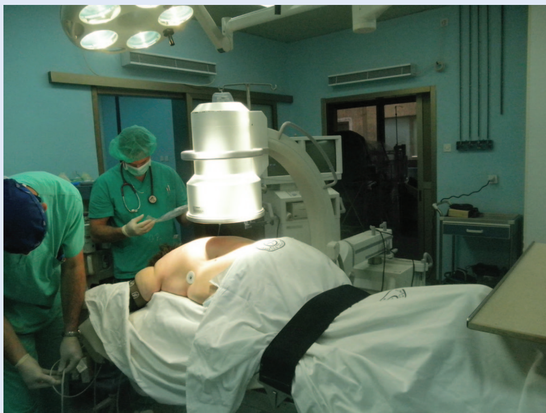
Slika 2. Položaj C-luka u a-p smjeru Figure 2 C-arm in a-p plane

Ova intervencija najčešće se izvodi pod kontrolom CT-a ili pomoću C-luka, budući da zahtijeva precizno pozicioniranje igle neposredno uz kori-