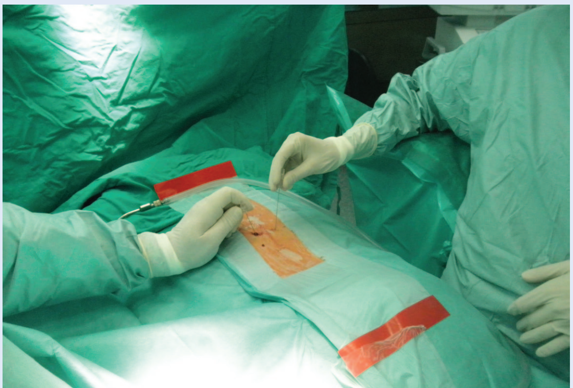
Slika 4. Obostrana blokada malih zglobova Figure 4 Facet joint syndrom injection