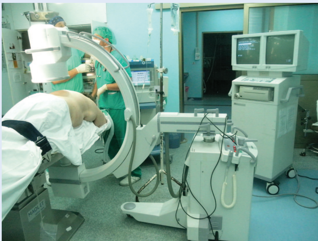
Slika 1. C-luk u operacijskoj sali Figure 1 C-arm in operating room

Značajna uloga radiologije je u dijagnostici. Određeni broj bolesnika osjetio je terapijske blagodati postupaka koji se izvode pod kontrolom RTG-a, dok velika većina kirurških struka ne može zamisliti niti jednostavnije zahvate bez njegove uporabe. C-luk standardni je dio opreme svake operacijske dvorane.