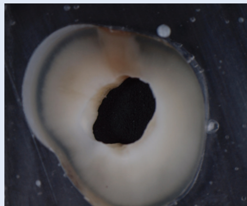
Slika 2. Presjek cervikalne trećine korijenskog kanala nakon 5-minutnog djelovanja EDTA-e Figure 2. Cross section of the cervical third of root canal after five minute irrigation with EDTA