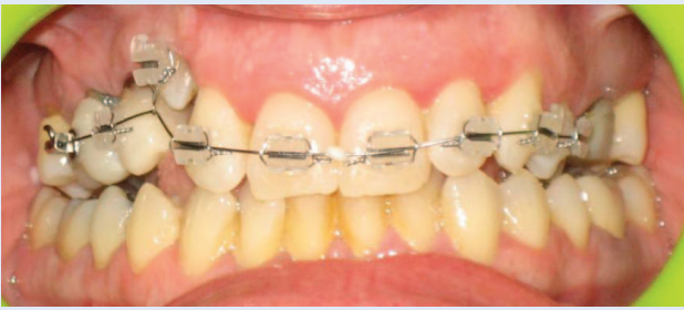
Slika 6b. Postavljena fiksna ortodonska naprava – prednji snimak Figure 6b. Fixed appliance – frontal view