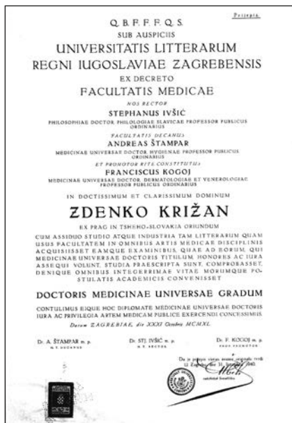
Slika 4. Prijepis diplome o stečenoj tituli doktor medicine.