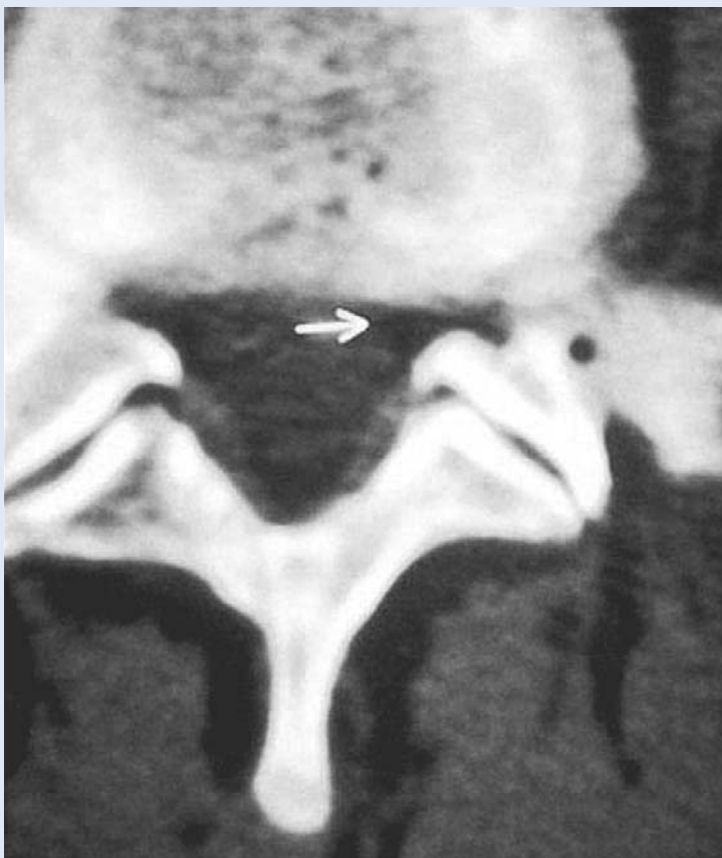
Slika 2. Stenoza lateralnog recessusa prikazana na CT-u Figure 2. Lateral recess stenosis visible by CT.

Kako je uzrok koštana kompresija jednog ili više živčanih korjenova, operacijsko otklanjanje kompresivnog uzroka daje priznato dobar rezultat. U čistom sindromu lateralnog recessusa to je meto-