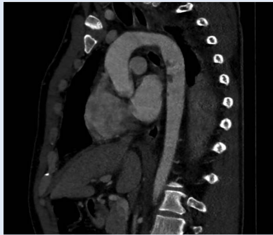
Slika 1. CT rekonstrukcija torakalne aorte – defekti kontrastnog punjenja ukazuju na trombotske mase uz stijenku, što indirektno sugerira leziju intime; ne vide se disekcije ni okolni hematomi

Prednost manje invazivnog endovaskularnog zahvata jest što ne zahtijeva klemanje aorte niti veliki kirurški rez 13 . Otvoreni pristup je prvi put izveden 1959. godine te uključuje torakotomiju, plućnu ventilaciju, sistemsku antikoagulaciju, uporabu kardiopulmonalne prenosnice i klemanje aorte. Endovaskularni pristup liječenju aorte prvi je put izveden 1991. za liječenje abdominalnih aneurizama. Zahvat je vrlo brzo pronašao svoju primjenu i u liječenju traumatskih ozljeda