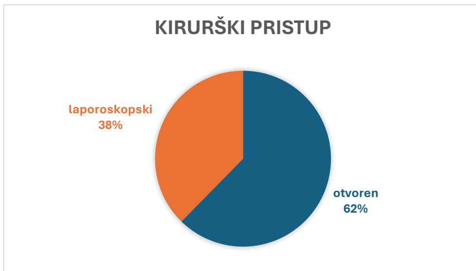
Slika 2. Udjeli kirurških pristupa nefrektomiji

Desni bubreg je operiran u 83 bolesnika (51,23%) a lijevi u 79 bolesnika (48,77%).