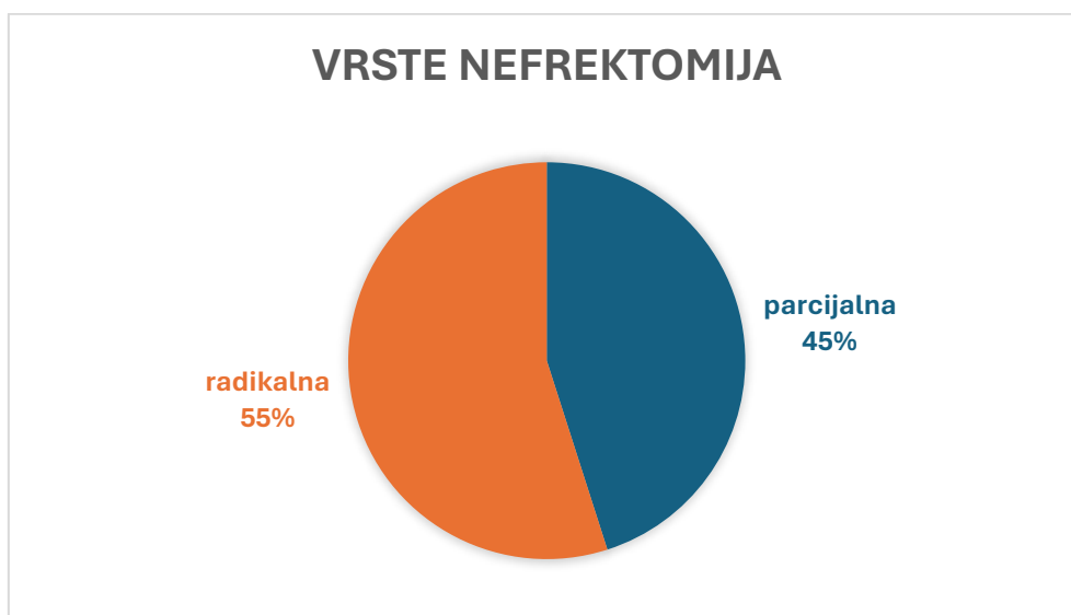
Slika 1. Udjeli vrsta izvedenih nefrektomija u bolesnika

U razdoblju od 1.1.2021. do 31.12.2022. godine u Kliničkom bolničkom centru Rijeka operirano je 162 bolesnika s dijagnozom karcinoma bubrega. Udio muškaraca je bio 64,20%, a udio žena 35,80% u ukupnom uzorku. Prosječna starost je bila jednaka u oba spola i iznosila je 65 godina. U 2021. godini je operirano 76 pacijenata (46,91%) dok je preostalih 86 pacijenata (53,09%) u 2022. godini. Izvršeno je 73 parcijalnih i 89 radikalnih nefrektomija čiji udjeli su prikazani (slika 1). Kirurški pristup je bio otvoren ili laporoskopski (slika 2). Ukupan broj laporoskopskih parcijalnih nefrektomija je bio 23 dok je otvorenih parcijalnih bio 50. Od 89 izvedenih radikalnih nefrektomija u uzorku, 38 ih je bilo laporoskopskim pristupom a 51 otvorenim pristupom.