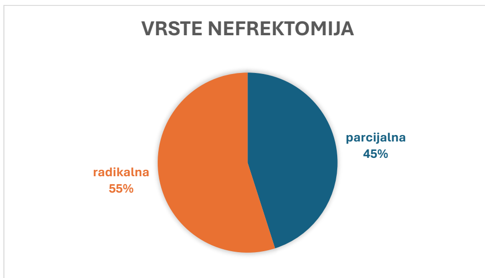
Slika 1. Udjeli vrsta izvedenih nefrektomija u bolesnika

U razdoblju od 1.1.2021. do 31.12.2022. godine u Kliničkom bolničkom centru Rijeka operirano je 162 bolesnika s dijagnozom karcinoma bubrega. Udio muškaraca je bio 64,20%, a udio žena 35,80% u ukupnom uzorku. Prosječna starost je bila jednaka u oba spola i iznosila je 65 godina. U 2021. godini je operirano 76 pacijenata (46,91%) dok je preostalih 86 pacijenata (53,09%) u 2022. godini. Izvršeno je 73 parcijalnih i 89 radikalnih nefrektomija čiji udjeli su prikazani (slika 1). Kirurški pristup je bio otvoren ili laporoskopski (slika 2). Ukupan broj laporoskopskih parcijalnih nefrektomija je bio 23 dok je otvorenih parcijalnih bio 50. Od 89 izvedenih radikalnih nefrektomija u uzorku, 38 ih je bilo laporoskopskim pristupom a 51 otvorenim pristupom.