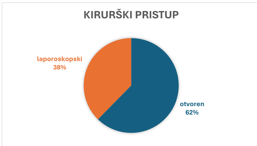
Slika 2. Udjeli kirurških pristupa nefrektomiji

Desni bubreg je operiran u 83 bolesnika (51,23%) a lijevi u 79 bolesnika (48,77%).