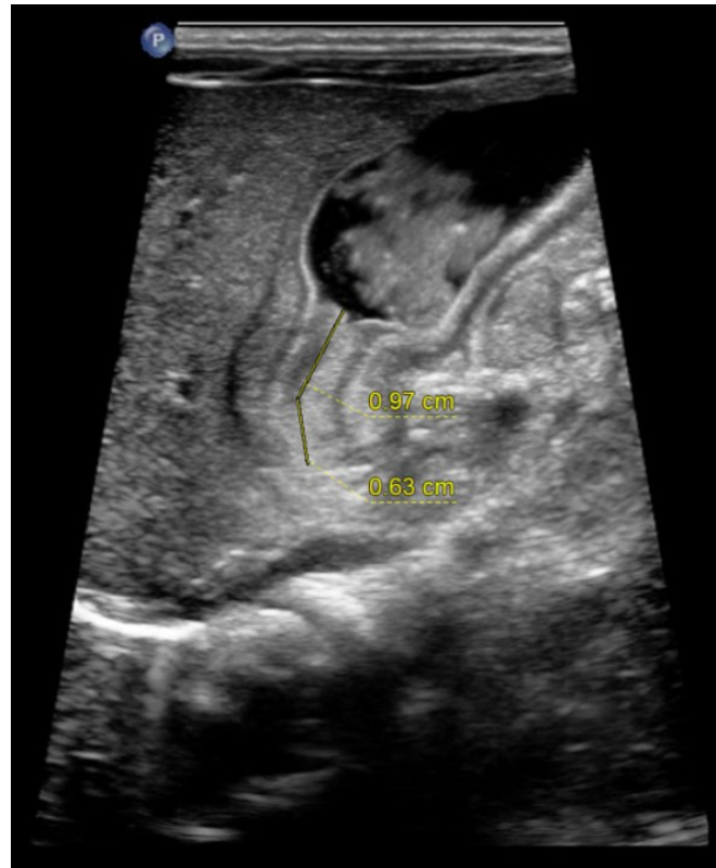
Slika 2: Slika prikazuje ultrazvuk abdomena na kojem je vidljiva HSP (34)

mišića u antrum i beak sign , koji označava kljunasti oblik pilorusa. (31, 32) Senzitivnost fluoroskopije je 95% i ovisi o iskustvu liječnika. (33)