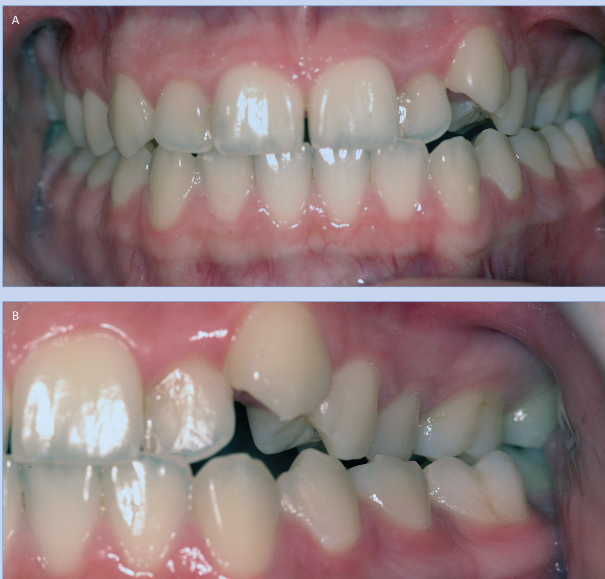
Slika 1. Bolesnica u habitualnoj okluziji (a). Križni zagriz od zuba 22 distalno na lijevoj strani gornje čeljusti (b) Figure 1. The patient in bite of convenience (a). Cross-bite distal from 22 on left side of the maxilla (b)

U svrhu potvrde kliničke dijagnoze bolesnica je snimila čeljusne zglobove magnetskom rezonancijom. S obzirom na biomehaniku čeljusnog zгло-