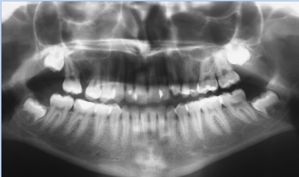
Slika 2. Ortopantomogramski prikaz zubi Figure 2. Panoramic radiograph of the teeth

U studiji je opisan klinički slučaj 12-godišnje bolesnice s temporomandibularnim poremećajem i križnim zagrizom, za koji je indicirano pažljivo ortodontsko liječenje kao oblik definitive rehabilitacije. Križni zagriz se ne smatra okluzijskom anomalijom povezanom s temporomandibularnim poremećajima, ali je za bolesnika od iznimne važnosti utvrditi odgovarajuću mjeru dijagnostičkih i terapijskih postupaka kojima se može poboljšati funkcija žvačnog sustava.