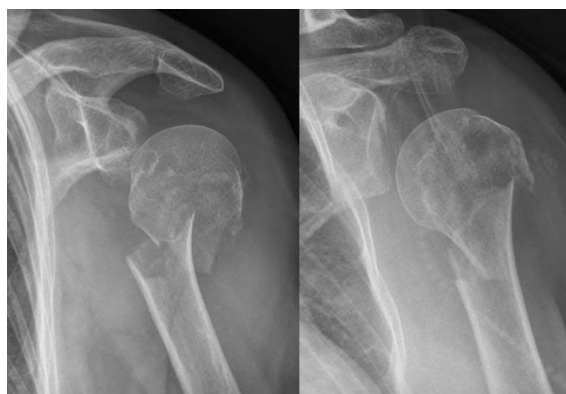
Slika 1. Prijelom proksimalne trećine humerusa

zapažena, zbog čega nam nakon nekoliko dana dolazi do pojave ekhimoze i hematoma u resorpciji koji se spušta kaudalno duž fascijalnih pregrada prema laktu ili prsnoj koži. [5,6]