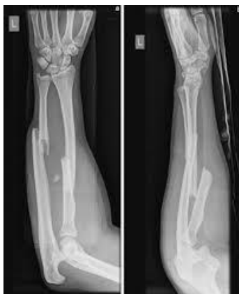
Slika 5. Prijelom u predjelu dijafize ulne i radijusa

proksimalnim pomakom radijalne glavice. U pacijenata se javlja bol u distalnom dijelu radioulnarnog zgloba uz smanjenu mobilnost. [5,6,11]