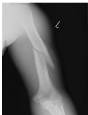
Slika 2. Prijelom dijafize humerusa

proksimalne trećine zbog blizine neurovaskularnih struktura potrebno je ispitati osjet, motoričku funkciju i pulzacije (8% primarnih ozljeda nervusa radialisa ). [5,6,7]