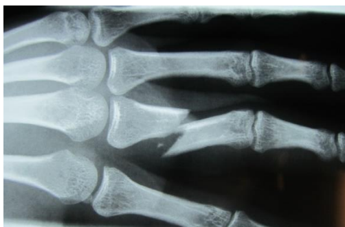
Slika 8. Rendgenski snimak trećeg polomljenog prsta

Iako prijelome prstiju većina ljudi shvaća kao lakše ozljede, neadekvatnim liječenjem mogu kod pacijenata izazvati trajne tegobe i otežati svakodnevni život. Iako su prsti vrlo malene strukture, oni obuhvaćaju anatomski i funkcionalno, obuhvaćaju koštani sustav, tetive i neurovaskularne snopove. Upravo zbog ovakvog ustroja moguća je fina motorika ruke. Do prijeloma najčešće dolazi prilikom djelovanja izravne sile (udarac), što utječe na oblik prijeloma. U odraslih najčešće dolazi do ozljede na poslu i tako uzrokuje trajni gubitak funkcije zbog čega imaju veliko gospodarsko značenje; u djece do ozljeda dolazi najviše prilikom bavljenja sportom (loptački i borilački sportovi). Postoji niz podjela prijeloma prstiju, kada je riječ o prijelomnoj pukotini može ih se podijeliti na poprečne, kose, spiralne i višeiverne. Nadalje, prijelomi se mogu podijeliti na prijelome proksimalnog, srednjeg i distalnog članka. Ne bitno o kakvom se prijelomu radi, oni u većini slučajeva uzrokuju deformirani izgled prsta. Uz deformaciju, ozlijeđeni prst je izrazito bolan, otečen i pokretljivost je svedena na minimum. [5,6,9]