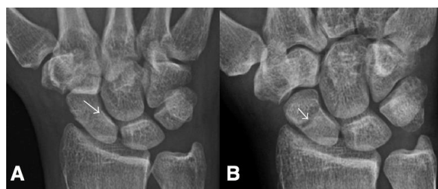
Slika 7. Prijelom skafoidne kosti

karpalnih prijeloma. Oko 90% svih bolesnika čine muškarci u dobi između 15 i 30 godina. Prilikom pada na ruku sva sila se prenosi na dlan, posebice radijalni rub šake koja je savijena u ručnom zglobu prema dorzalno. Jedna od specifičnosti je vaskularizacija (od distalno k proksimalno) zbog čega se javljaju poteškoće prilikom cijeljenja. Zbog svoje masivnosti, prijelome skafoidne kosti možemo podijeliti na distalne prijelome u području tuberkula, te na prijelome u distalnoj, srednjoj i proksimalnoj trećini skafoidne kosti. Druga podjela može biti na jednostavne i viševerne (pad na šaku koja je ularno abducirana) prijelome, s ili bez pomaka ulomka. Također su brojna istraživanja pokazala kako je otežano srašćavanje kod vertikalnih i viševernih, rezultat međusobno nestabilnih ulomaka. Nerijetko ovi prijelomi ostanu neprepoznati što kasnije rezultira stvaranjem pseudoartroza ili avaskularnim nekrozama, čija posljedica bude trajno oštećenje ručnog zgloba. Kada simptomi ipak budu vidljivi oni najčešće budu ekhimoze u navedenom području, otok, otežana pokretljivost i bolnost u području ručnog zgloba. Specifični patognomoničan znak je taj da prilikom izvođenja perkusije glavice treće metakarpalne kosti, dolazi do jake bolnosti u području skafoidne kosti. Također važno je napraviti detaljan neurološki pregled jer kod ovakvog tipa ozljede kao komplikacija se može javiti sindrom karpalnog tunela ili oštećenje ularnog živca. [15]