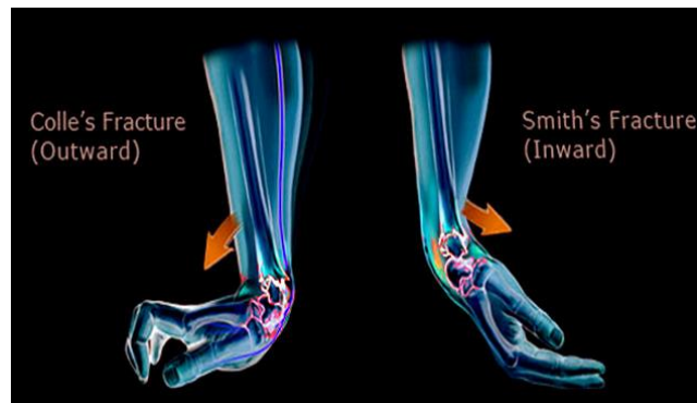
Slika 6. Collesova i Smithova fraktura

Komplikacije su vrlo rijetke, moguća je kompromitiranost medijalnog živca, pojava sindroma karpalnog tunela i kompartment-sindrom, no to se događa kod velikih dislokacija. [5,6,13,14]