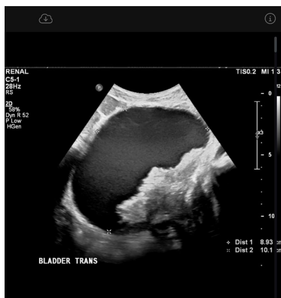
Slika 1 Ultrazvučni prikaz karcinoma mokraćnog mjehura. (8)

su neki krajevi, poput suptropskog i tropskog pojasa, naseljeni metiljem Shistosomom koja je jedan od etioloških čimbenika nastanka. Također, potrebno je pažnju posvetiti socijalnoj anamnezi. Vrsta rada i rad s anilinskim bojama smatramo uzročnikom karcinoma mokraćnog mjehura. U fizikalnom statusu potrebno je dodatno palpirati mokraćni mjehur i uključiti ultrazvuk bubrega i mokraćnog mjehura. Prije daljnje dijagnostike potrebno je učiniti laboratorijski pregled sedimentacije urina i citološki pregled istog. (2) Zlatni standard dijagnostike tumora mokraćnog mjehura je cistoskopija te nakon nje transuretralna resekcija prilikom koje se uzima suspektna promjena za patohistološku analizu. U nekih bolesnika indicirana je magnetska rezonanca (MR) ili kompjuterska tomografija (CT) za evaluaciju proširenosti bolesti. Na sljedećim slikama prikazane su radiološke metode dijagnostike tumora mokraćnog mjehura (slika 1 i 2).