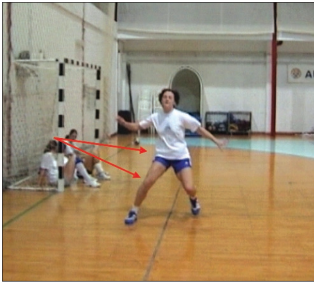
Slika 3. Naglo mijenjanje smjera s koljenom u valgus poziciji uz fiksirano stopalo, treba zamijeniti polukružnom kretnjom sa savijenim koljenom.

Figure 3. Changing direction with the knee in valgus position and fixed foot change in accelerated round turn with bent knee.