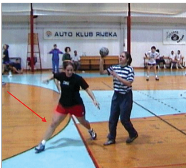
Slika 2. Zaustavljanje na mjestu u jednom koraku s ispruženim koljenom, treba zamijeniti s više kraćih koraka sa savijenim koljenima.

Figure 1. Jumping and landing on extended knees (straight knee landing change to bent knee landing)