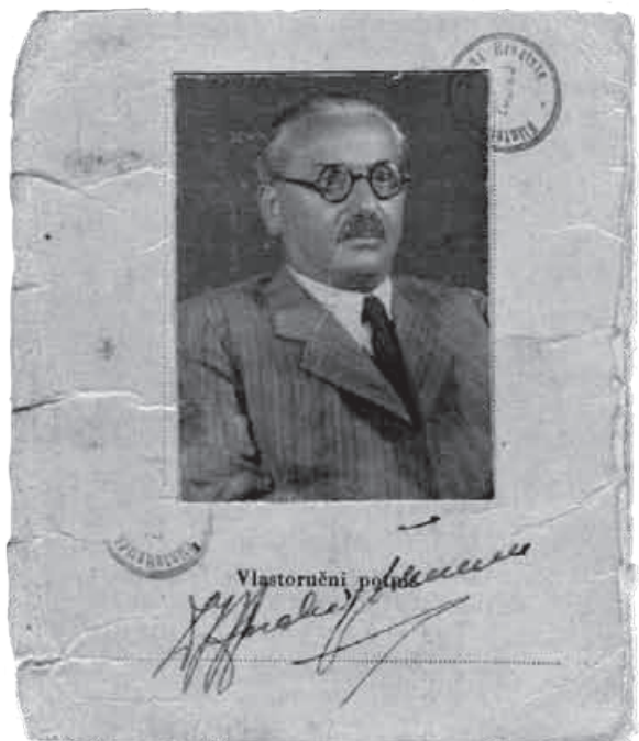
Slika 4. Dvije fotografije iz različitih životnih doba.