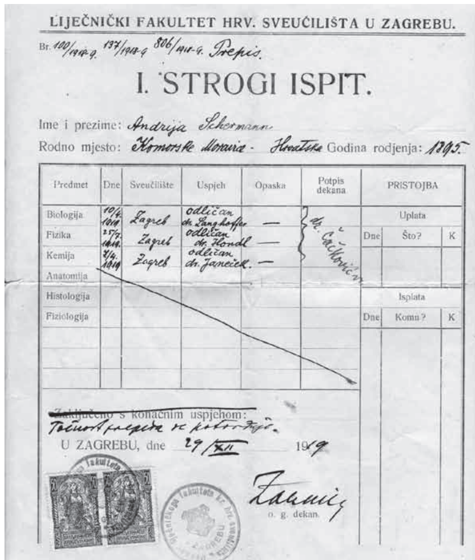
Slika 1. Svjedodžba o prvom rigorozu.

ziologiju ili medicinu 1936.). Nakon diplomiranja (u Grazu) radio je dvije godine (1922.-1924.) u Bolnici milosrdnih sestara (Vinogradska) u Zagrebu (od čega prva tri mjeseca 1924. na Klinici za ginekologiju i primaljstvo; (sl. 2), a potom postaje kotarskim liječnikom u Novom Vinodolskom. 4