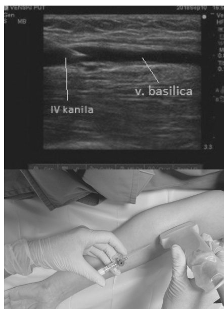
Slika 2. Ultrazvučni prikaz kateterizacije u „in plane“ tehnici (po dužini UTZ snopa).