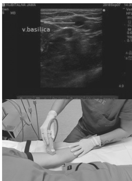
Slika 1. Ultrazvučni prikaz vene u „out of plane“ tehnici (poprečno na UTZ snop).