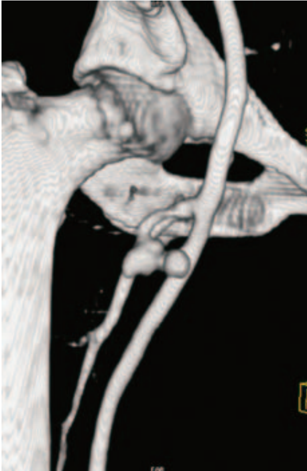
Slika 1. Rekonstrukcija MSCT angiografskog nalaza. Vidljiva je bisakularna pseudoaneurizma femoralne arterije.

Figure 1. MSCT angiography reconstruction. Bisaculular femoral artery pseudoaneurysm is noticeable.