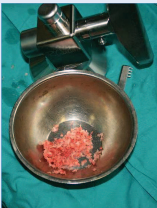
Slika 5. Mlinac za kost i samljevena kost s kriste ilijake