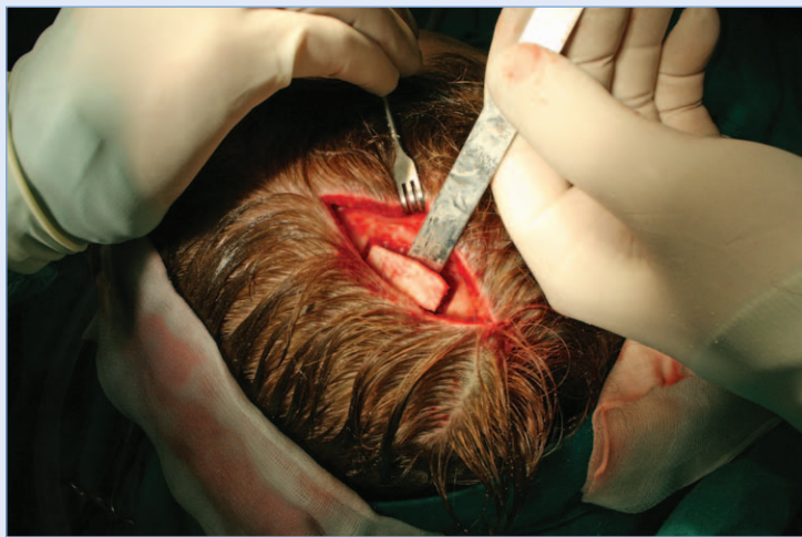
Slika 2. Kalvarijalni transplantat

se navesti nešto teže i duže uzimanje s donatorskog mjesta, teže modeliranje i rizik od frakture transplantata te vidljiv ožiljak kod pacijenta bez kose. Ovaj koštani transplantat je tanji od transplantata s kriste ilijake 7-10,14,15 .