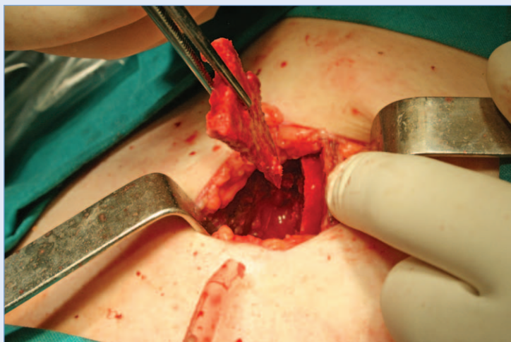
Slika 3. Transplantat s kriste ilijake

se navesti nešto teže i duže uzimanje s donatorskog mjesta, teže modeliranje i rizik od frakture transplantata te vidljiv ožiljak kod pacijenta bez kose. Ovaj koštani transplantat je tanji od transplantata s kriste ilijake 7-10,14,15 .