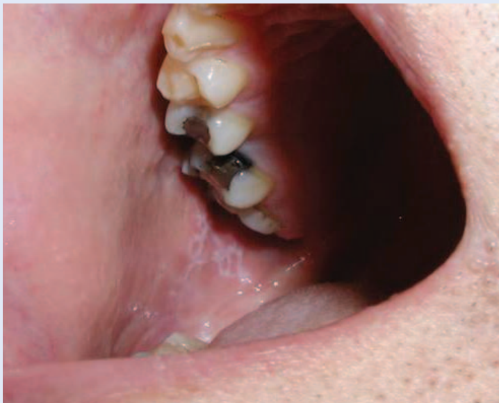
Slika 1. Oralni lihen planus – retikularni oblik na obraznoj sluznici.

Postoje brojne kliničke klasifikacije OLP-a. Prema Andreasenu 5 OLP se očituje u 6 kliničkih oblika: retikularni, papularni, plakozni, atrofični, erozivni i bulozni. Silverman i sur. 6 predložili su pojednostavljenu klasifikaciju OLP-a na retikularni, atrofični i erozivni oblik. Bagan i sur. 7 Klasificirali su