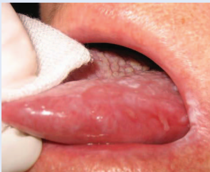
Slika 2. Oralni lihen planus – erozivni i atrofični oblik na jeziku.

Razlika električnog potencijala između legura u usnoj šupljini mjerena je pomoću originalno napravljenog kompjutorski kontroliranog milivoltmetra čiji softver sadrži algoritme za digitalnu obradu signala i filtriranje (Vesco Informatika d. o. o. u suradnji s Fakultetom elektrotehnike i računarstva Sveučilišta u Zagrebu, Hrvatska). Milivoltmetar uključuje dvije elektrode koje se oslone na različite legure te se na ekranu kompjutera očitavana razlika električnog potencijala (slika 3). Vrijednost razlike električnog potencijala između dviju elektroda/legura ovisi o elektrokemijskom oksidacijsko-redukcijskom procesu koji se dešava na objema elektrodama/legurama 16,17 .