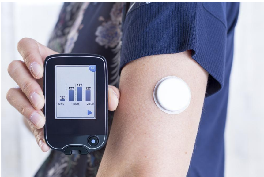
Slika 2: Uređaj za kontinuirano mjerenje glukoze (14)

Kontinuirano mjerenje glukoze (CGM, prema engl. Continuous Glucosae Monitoring) treba uzeti u obzir kod sve djece i adolescenata sa ŠB tipa 1, bilo da koriste injekcije ili terapiju inzulinskom pumpom, kako bi se poboljšala kontrola glikemije. Prednosti CGM-a koreliraju s kontinuiranošću uporabe uređaja. (10) Sustavi CGM-a mjere intersticijsku koncentraciju glukoze putem potkožnog senzora svakih 3 do 5 minuta i prenose rezultat na uređaj za očitavanje (Slika 2.). To se radi aktivno i kontinuirano (CGM u stvarnom vremenu) ili pasivnim skeniranjem. Terapijski ciljevi koji se mogu postići primjenom CGM sustava kod djece s dijabetesom uključuju smanjenje učestalosti hipoglikemijskih epizoda (osobito noću) i izbjegavanje ozbiljnih hipoglikemijskih epizoda u kojima je bolesniku potrebna pomoć druge osobe. (13)