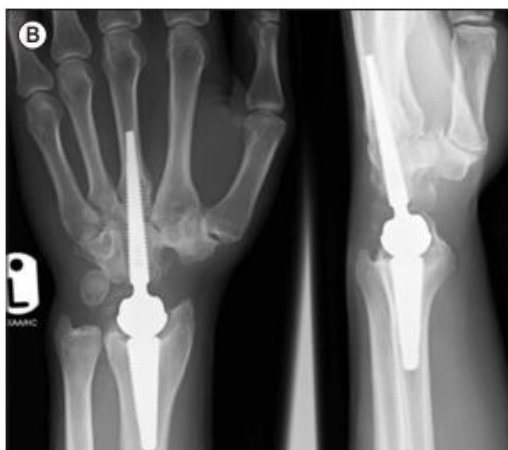
Slika 6. Motec endoproteza

Izvor: Giwa L, Siddiqui A, Packer G. Motec Wrist Arthroplasty: 4 Years of Promising Results. J Hand Surg Asian Pac Vol. 2018; 23(03): 364–8.