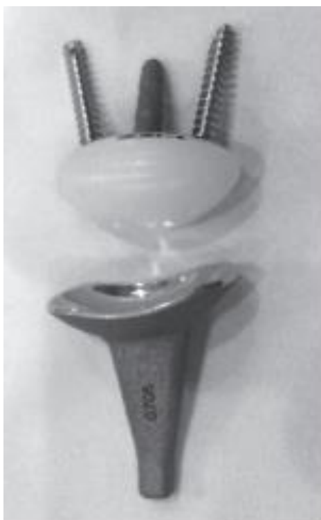
Slika 5. Re – Motion endoproteza