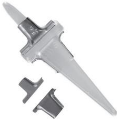
Slika 2. Swanson endoproteza ručnog zgloba 1. generacije

a proksimalna u palčanu kost (28) [Slika 2]. Preživljenje je prema Swansonu bilo 90% nakon 4 godine, a od ukupno 47 bolesnika u njih 51% je navodilo smanjenje boli nakon 5.8 godina (29). Iako se u početku smatralo da su silikonski implantati inertni, čak 30% bolesnika je razvilo silikonski sinovitis. Od ostalih komplikacija se navodi prijelom implantata, perzistentna bol te disbalans ekstenzornih tetiva (30).