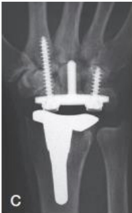
Slika 4. Universal 2 endoproteza

Suvremene endoproteze ručnog zgloba spadaju u 4. generaciju, a prvi predstavnik je endoproteza Universal 2 koja može biti cementna ili bezcementna za razliku od prošlih generacija endoproteza gdje su sve bile samo cementne (36) [Slika 4.].