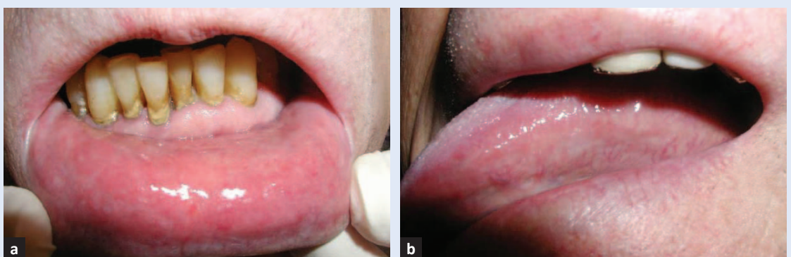
Slika 6. Nalaz oralne sluznice na kontrolnom pregledu nakon 2 mjeseca. a) Sluznica donje usnice bez upale i lezija; b) sluznica lateralnog ruba jezika bez upale i lezije.

Na kontrolnom pregledu nakon 3 mjeseca pacijent se dobro osjećao. Oralna sluznica bila je zdravog izgleda, no suhoća usta bila je i dalje prisutna. Pacijentu je savjetovano liječenje za suha usta. U redovitim je kontrolama u ordinaciji oralne medicine svakih 6 mjeseci.