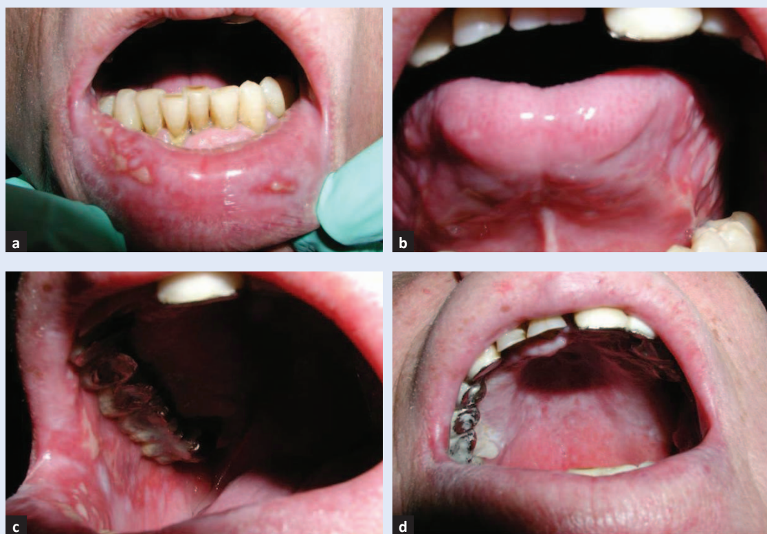
Slika 4. Oralni mukozitis na kontrolnom pregledu nakon 7 dana. a) Sluznica donje usnice s blagom upalom i nekoliko erozija; b) sluznice vrška i lateralnih rubova jezika s blagom upalom i erozijama; c) sluznica obraza s blagom upalom i erozijama; d) sluznica nepca bez upale.