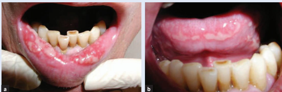
Slika 2. Oralni mukozitis na kontrolnom pregledu nakon 4 dana. a) Sluznica donje usnice s upalom i erozijama; b) sluznice vrška i lateralnih rubova jezika s upalom i erozijama.