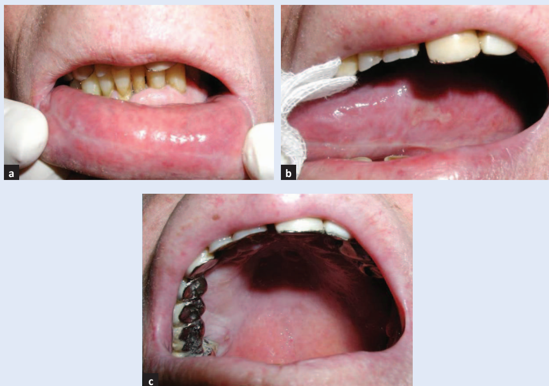
Slika 5. Oralni mukozitis na kontrolnom pregledu nakon 11 dana. a) Sluznica donje usnice bez lezija i upale; b) sluznica lateralnih ruba jezika s erozijom; c) sluznica nepca bez upale.