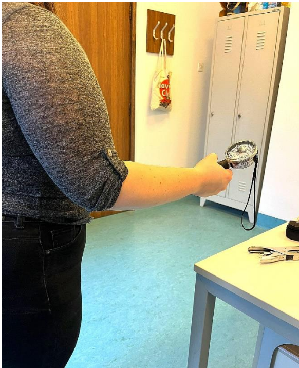
Slika 2. Procjena mišićne snage mjerenjem jačine stiska šake uz pomoć ručnog dinamometra

Za određivanje sarkopenije koristi se i ručna dinamometrija, metoda koja prikazuje promjene u mišićnoj snazi pomoću dinamometra. Dinamometar služi za mjerenje sile ili snage te daje informacije o stanju mišićno-koštanog sustava. Važno je da je osoba koja se podvrgava testu nezagrijana jer u suprotnom slučaju test je neadekvatan zbog povećane snage stiska. Za test su dostatna 3 pokušaja za maksimalnu snagu bez značajnijeg odmora između pokušaja. (7)