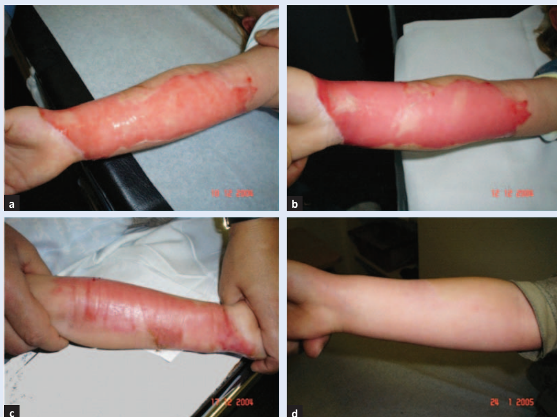
Slika 1. Opekline kože podlaktice IIA° s oštećenjem epidermisa i površnog dermisa prikazana tijekom liječenja sve do potpunog zacjeljenja: a) 2.; b) 4.; c) 9. dana i d) 6 tjedana nakon ozljede.

Osim procjene dubine (površne i duboke) važna je i procjena površine opekline. Brza procjena površine računa se "pravilom dlana" koji predstavlja 1 % ukupne površine tijela. Berkowljeva ili Lund-Brodwderova shema su preciznije, uzimaju u obzir dijelove tijela i godine starosti. Procjenom navedenih parametara opekline se kategoriziraju u lake, umjerene i teške.