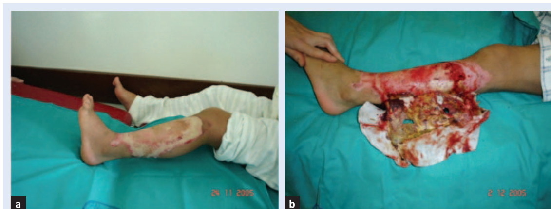
Slika 3. Opekline kože potkoljenice III° koja je karakterizirana nekrozom kože i potkožnog tkiva prikazana a) 4. i b) 12. dana tijekom konzervativnog liječenja Aquacel Ag oblogom.

kirurško uklanjanje nekrotičnog sloja, a nakon cijeljenja često ostaju hiperpigmentacije i ožiljci (slika 2).