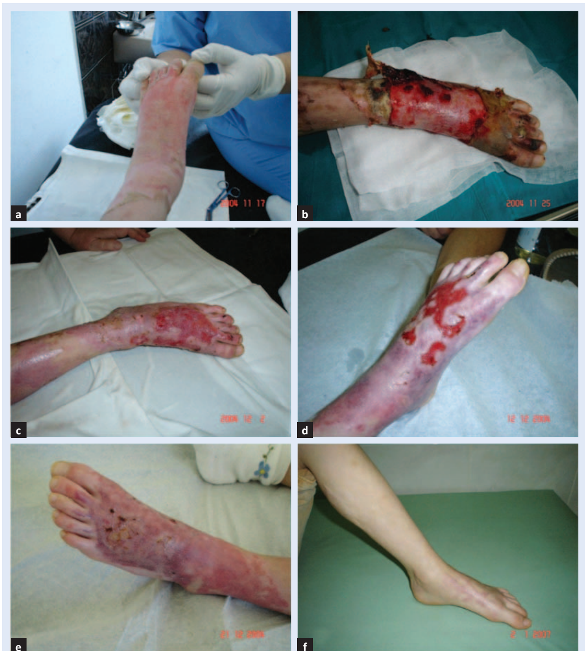
Slika 2. Opeklina kože distalnog dijela potkoljenice i stopala IIB° karakterizirana dubljim oštećenjem dermisa i duljim izlječenjem: a) 2.; b) 9.; c) 16.; d) 26. i e) 35. dana te f) dvije godine nakon konzervativnog liječenja.

Opeklina IIB° – obilježena je crvenilom, plikovima, oštećenjem dubokih slojeva dermisa, znojnih i lojnih žlijezdi te ležištem dlake. Koža je edematozna, njena površina je vlažna i crvenkastosmeđa, a potkožno tkivo ne blijedi na pritisak. Cijeljenje opekline je usporeno i obično zahtijeva