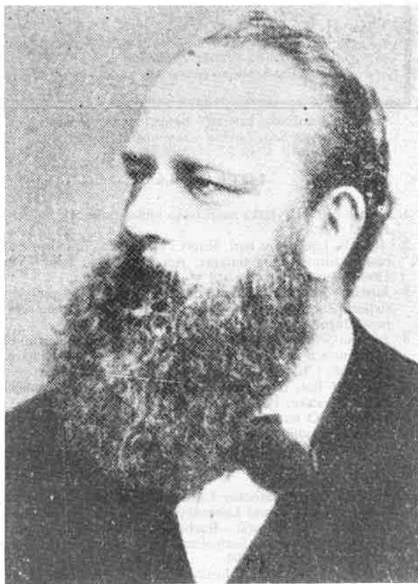
Sl. 6. Theodor Billroth Fig. 6.

doprinos je dao i pri organizaciji IV. međunarodnog kongresa za talasoterapiju koji je održan u Opatiji od 28. do 30. rujna 1908. 19