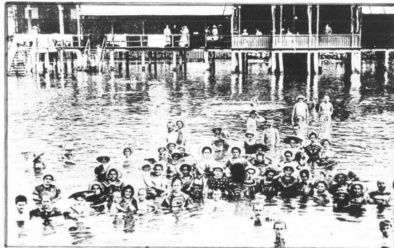
Sl. 1. Kupači u Crikvenici Fig. 1. Bathers in Crikvenica

Cilj koji smo si u ovom prikazu postavili svojevrsan je pokušaj davanja priloga bibliografskom projektu u