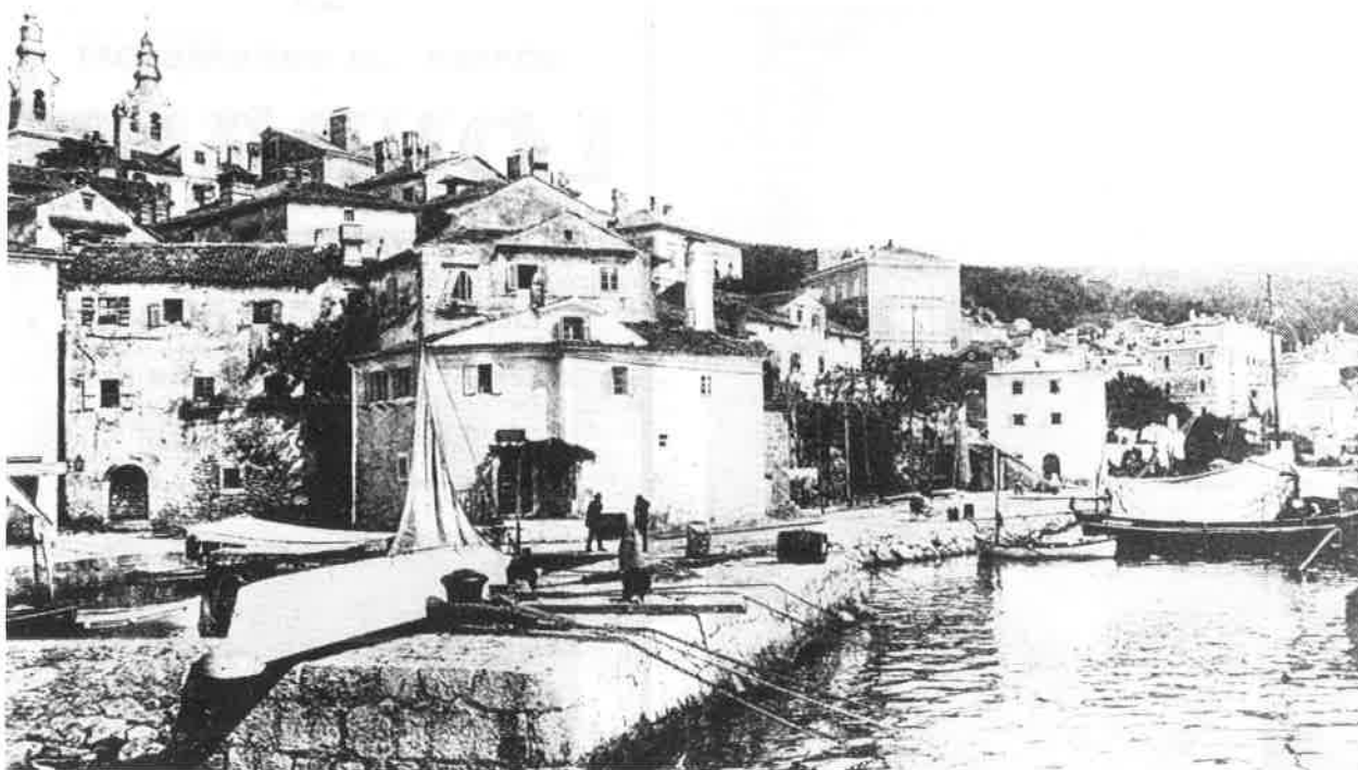
Sl. 5. Volosko Fig. 5.