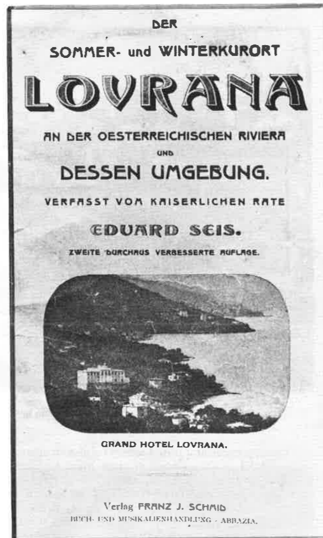
Sl. 8. Edvard Seis: Lovran – ljetne i zimske toplice Fig. 8. Edvard Seis: Lovran – summer and winter spa

Ovaj pregled može djelovati impresivno brojem liječnika i drugih javnih i kulturnih radnika promotora zdravstvenog turizma u Hrvatskom primorju, iako smo svjesni da su neka imena izostala. Stoga nalazimo da istraživanje nije završeno te da ga treba nastaviti kako o pojedinim mjestima, tako i o pojedinim ličnostima koje nedvojbeno zaslužuju cjelovitiju prezentaciju i primjenu evaluaciju.