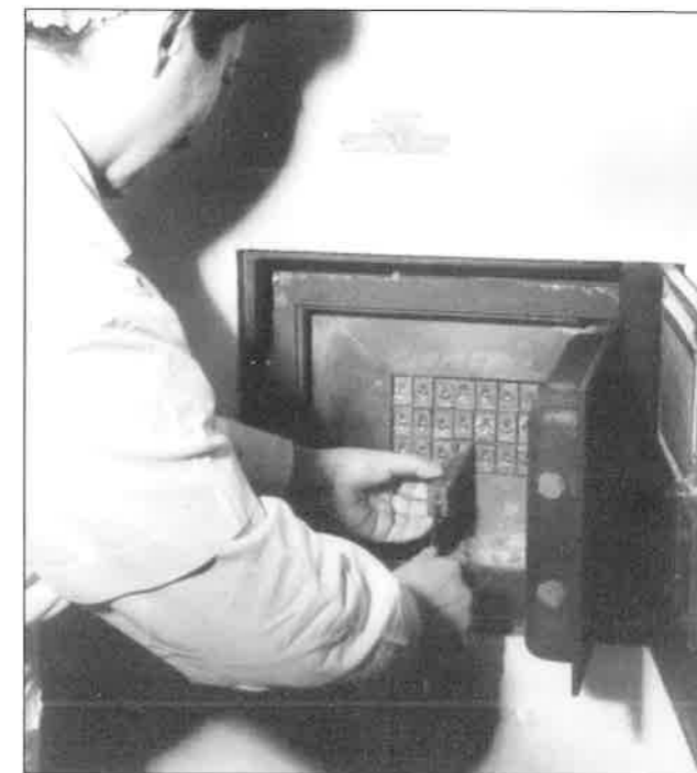
Slika 1. Olovni sef s pretincima za pohranu radija iz 1934. godine u Zavodu za radioterapiju i onkologiju KBC-a Rijeka.