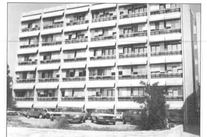
Slika 4. Na prvom katu Ginekologije smješten je 1985. novi dio Zavoda za radioterapiju i onkologiju KBC-a Rijeka.