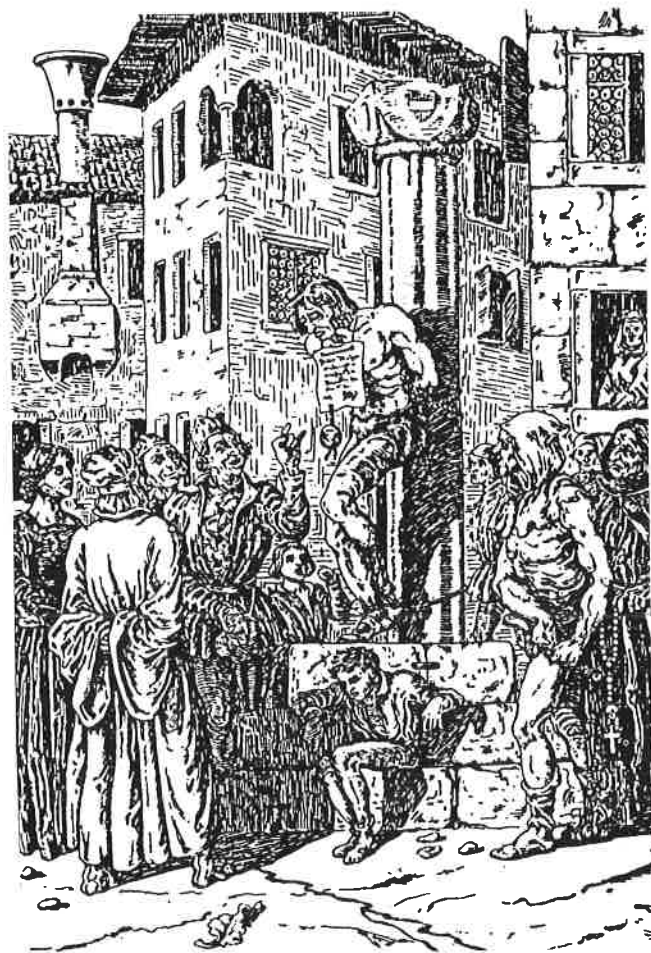
Slika 1. Ricardo Gigante – Stup srama na gradskom trgu u Rijeci (Gigante S. Fiume nel Quattrocento, Fiume, 1913: str. 64.)

na repu konja vuče preko velikog trga ili gdje god bi to htjeli gospodin kapetan ili vikarij i poslije toga neka se odmah objesi na javnom i otvorenom mjestu sa željeznim lancem oko vrata, tako da umre, i neka se ostavi obješen na trajno gledanje i sjećanje... A povrh toga neka cijela imovina takvih buntovnika pripadne kraljevskom fiskusu i njegovoj komori, i u četvrtini našoj općini”.