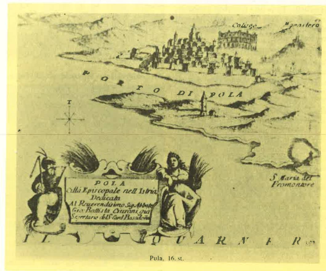
Slika 1. Pula u XVI. stoljeću. U desnom gornjem kutu vidi se samostan i opatija Sv. Mihovil nad Pulom

druga jednobrodna koja je služila kao mauzolej istarskim kneževima i njihovim porodicama. Samostan je bio izgrađen s lodama, parkom i vrtom za boravak i manualni rad redovnika (labor manuum), pa i za rekreaciju njihovu i njihovih gostiju. Temelje tih crkava mogao je promatrati, iako u ruševnom stanju, još Kandler u prošlom stoljeću. Međutim, i Locatelli je opisao 1590. godine raskoš ovih građevina na Mihovilovom brdu (11, 13) (slika 1). Potkraj šesnaestog stoljeća na tom su se mjestu mogla vidjeti uredna dvorišta, lođe i apartmani i mramorna cisterna. U sljedećem se stoljeću stanje u ovoj benedik- tinskoj opatiji sve više pogoršava. To je vrijeme kad su Istrom harale epidemije kuge i malarije, koje su inače imale značajan utjecaj na depopulaciju istarskog poluotoka. Vjerojatno je da je bogatstvo i