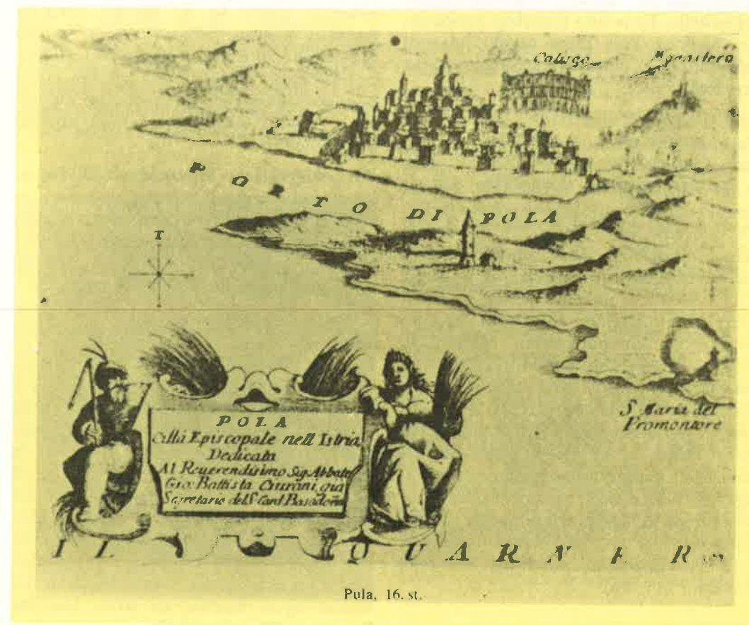
Slika 1. Pula u XVI. stoljeću. U desnom gornjem kutu vidi se samostan i opatija Sv. Mihovil nad Pulom

druga jednobrodna koja je služila kao mauzolej istarskim kneževima i njihovim porodicama. Samostan je bio izgrađen s lodama, parkom i vrtom za boravak i manualni rad redovnika (labor manuum), pa i za rekreaciju njihovu i njihovih gostiju. Temelje tih crkava mogao je promatrati, iako u ruševnom stanju, još Kandler u prošlom stoljeću. Međutim, i Locatelli je opisao 1590. godine raskoš ovih građevina na Mihovilovom brdu (11, 13) (slika 1). Potkraj šesnaestog stoljeća na tom su se mjestu mogla vidjeti uredna dvorišta, lođe i apartmani i mramorna cisterna. U sljedećem se stoljeću stanje u ovoj benedik- tinskoj opatiji sve više pogoršava. To je vrijeme kad su Istrom harale epidemije kuge i malarije, koje su inače imale značajan utjecaj na depopulaciju istarskog poluotoka. Vjerojatno je da je bogatstvo i