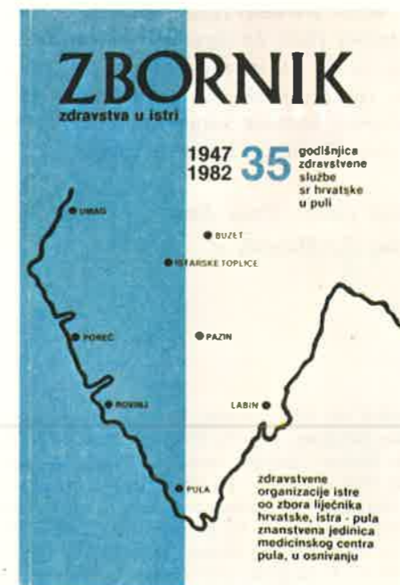
Slika 7. Naslovna strana četvrtog »Zbornika zdravstva u Istri« izdanog u povodu 35. obljetnice djelovanja zdravstvene službe SR Hrvatske u Puli

I Opća bolnica, i kasnije Medicinski centar prelazili su razne etape svog razvoja, bilježili su i uspone, ali ponekad i teške trenutke, no, razvojna se crta uvijek kretala prema gore (slika 6).