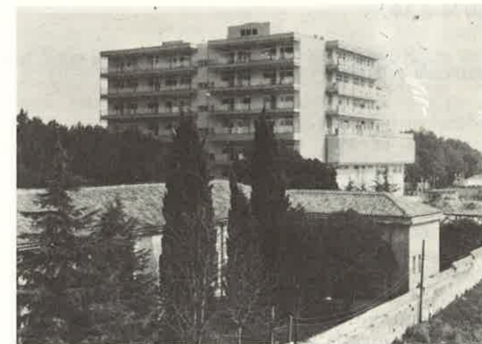
Slika 6. Nova zgrada Rodilišta i ginekologije Medicinskog centra u Puli otvorena 1979. godine. Na petom je katu smješten Dječji odjel

Pula ima i karakteristike kongresnog grada. Od 1960. godine održava se svake godine Neuropsihijatrijski simpozij koji je osnovao prof. dr Hans Bertha, a koji se od Jugoslavensko-austrijskog simpozija postupno razvio u ugledni međunarodni skup s brojnim sudionicima iz evropskih, pa i izvanevropskih zemalja.