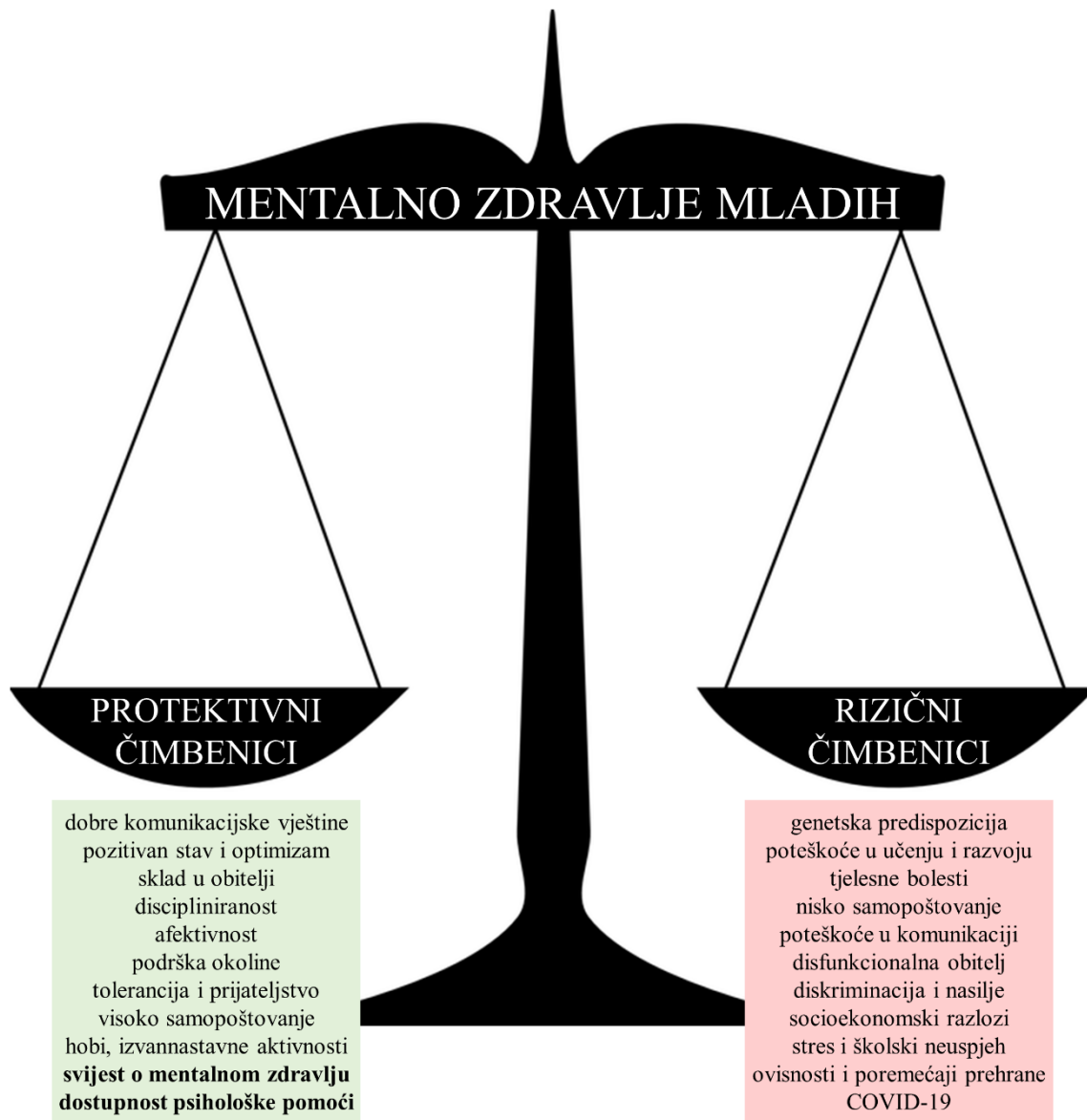
Slika 2. Mentalno zdravlje mladih predstavlja ravnotežu između brojnih rizičnih i protektivnih čimbenika.