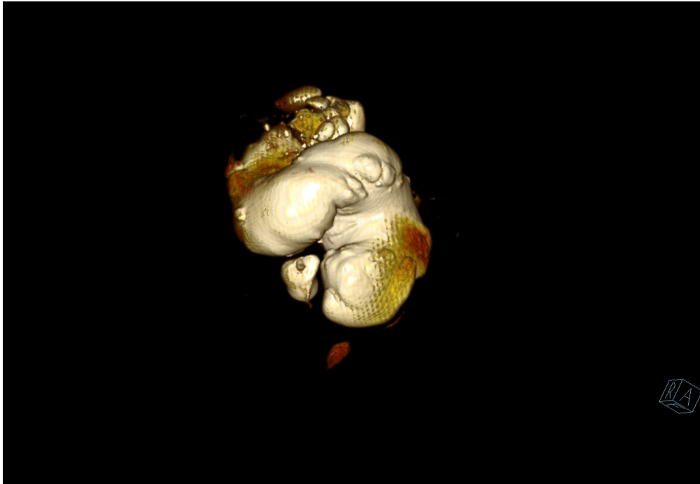
Slika 2. Ureterohidronefroza desno, MRU prikaz, 3D rekonstrukcija.