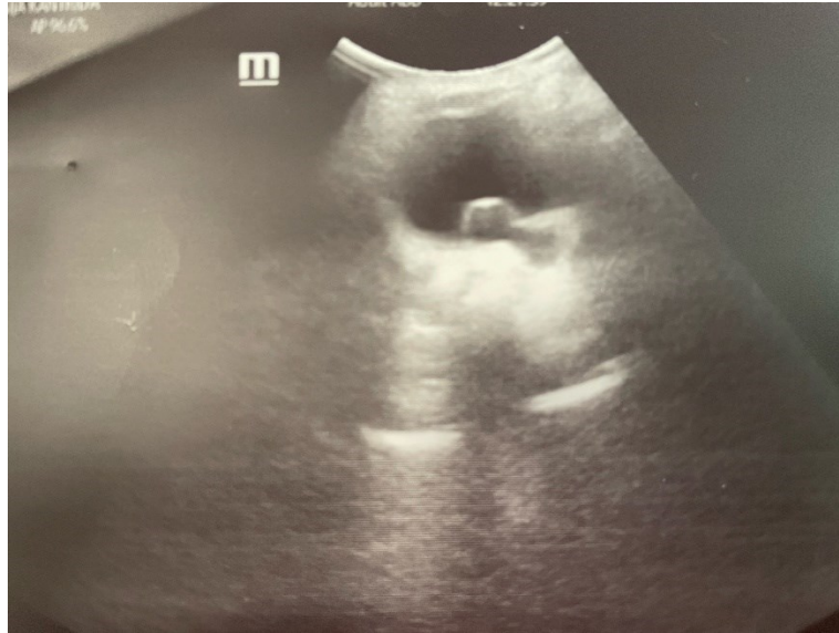
Slika 3: Ultrazvučni prikaz ureterokele.