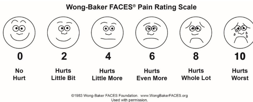
Slika 1: Wong-Baker FACES Pin Rating Scale.

nasmiješenog do uplakanog. Lica nisu obojana bojom kako bi se izbjegla subjektivnost i sugestibilnost koju određena boja pokazuje. Svako lice pokazuje koliko nešto može boljeti. Tako prvo, nasmiješeno, sretno lice pokazuje da nema boli, dok zadnje, tužno, uplakano lice označava najjaču bol koja se može zamisliti. Pokazujući redom na lica i objašnjavajući što koje lice predstavlja, od djeteta se traži da izabere lice koje najbolje opisuje bol koju osjeća. Nakon što dijete izabere lice, zabilježi se odgovarajući broj (1,11,12).