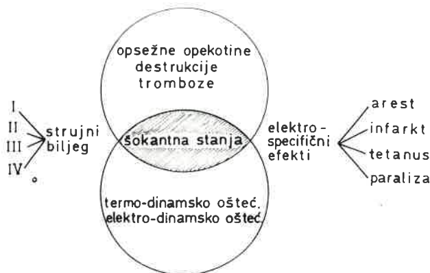
Pregledni prikaz oštećenja uslijed djelovanja električne struje.