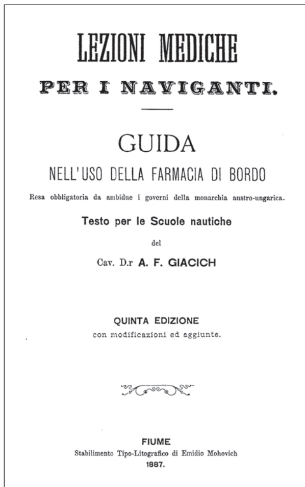
Slika 3. Naslovnica priručnika Lezioni mediche per i naviganti