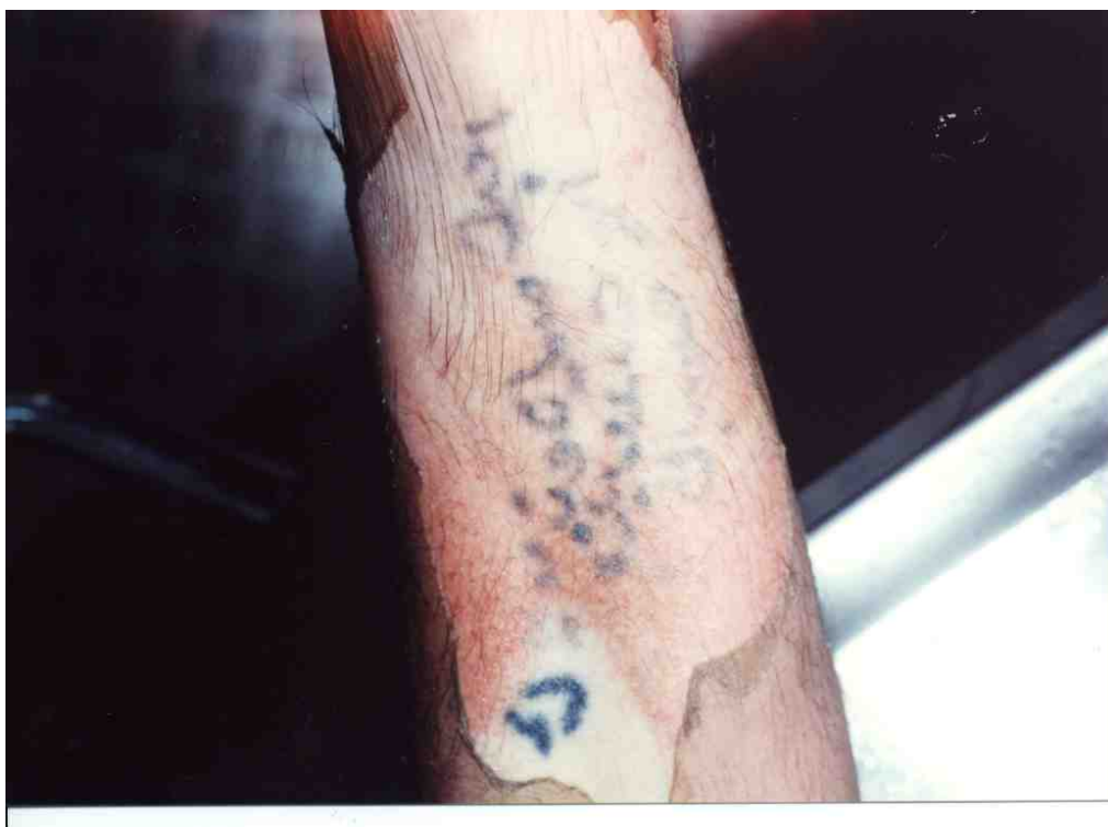
Slika 1 Prikaz tetovaže vidljive nakon odljuštenja epidermisa [13]

Pošto se pigment tetovaže odlaže u dermisu, one mogu biti korisne i kod identifikacije tijela u početnim stadijima raspadanja, kod tijela koja su duže vrijeme bila u vodi, kao i kod tijela s površinskim opeklinama kože. [4]