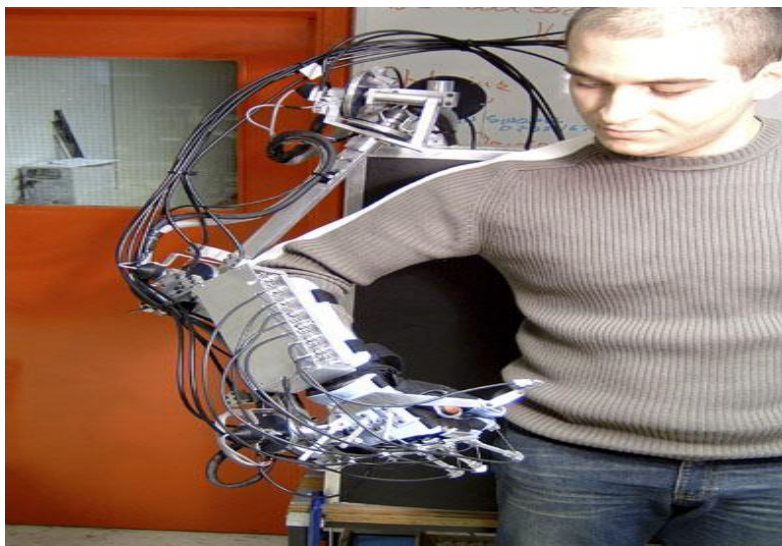
Slika 1. Egzoskeletni rehabilitacijski robot

“End effector” roboti imaju robotsku ruku koja je svojim krajem povezana sa bolesnikom te pokreti robota nisu istovjetni s pokretima ruke bolesnika nego pomičući svoj kraj utječu na pokrete ruke. Motori robota su smješteni u bazi uređaja te je samim time potrebna manja snaga motora što za posljedicu ima puno manji otpor pokretu. Ovi uređaji su veći i teži od egzoskeletnih uređaja ali se puno lakše mogu prilagoditi pojedincu.