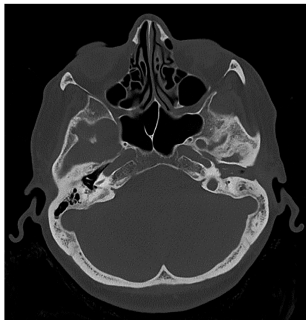
Figure 1: MSCT of the temporal bone suggests a cholesteatoma of the left middle ear alongside the destruction of the roof of the pyramid with communications toward the middle cranial Fossa and the present pathological substrate in the Eustachian tube.

Slika 1. MSCT temporalne kosti sugerira kolesteatom srednjeg uha lijevo uz dehiscijenciju krova piramide s komunikacijom prema srednjoj lubanjskoj jami uz prisutnost patološkog supstrata u Eustahijevoj tubi.