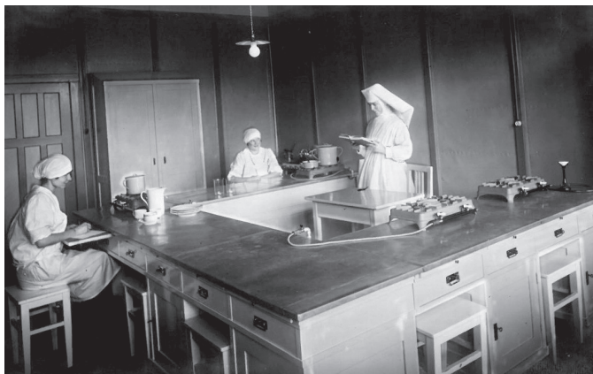
SLIKA 1. Sestre pomoćnice u kuhinji Škole za sestre pomoćnice u Zagrebu osposobljavaju se za kuharske tečajeve, međuratno razdoblje, privatno

Iz sačuvanog obračuna i izvještaja za higijensko-domaćinski tečaj u Bribirskoj ulici na Trešnjevci 1935. godine možemo zapaziti dodatne detalje koji pružaju još plastičniji uvid u organizaciju i mjesto održavanja. Tako saznajemo da je spomenuti tečaj bio organiziran u privatnoj kući i da su na raspolaganju bile dvije sobe i kuhinja.