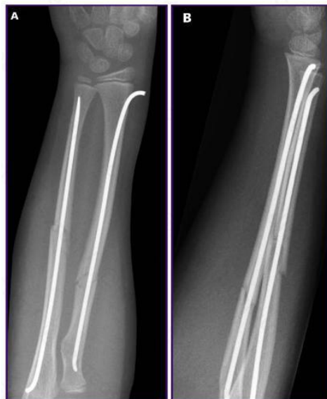
Figure 3. Anterior-posterior (A) and lateral (B) X-rays of a forearm fracture treated by elastic stable intramedullary nailing.