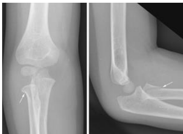
Slika 5. Prijelom vrata radijusa u četverogodišnjeg djeteta