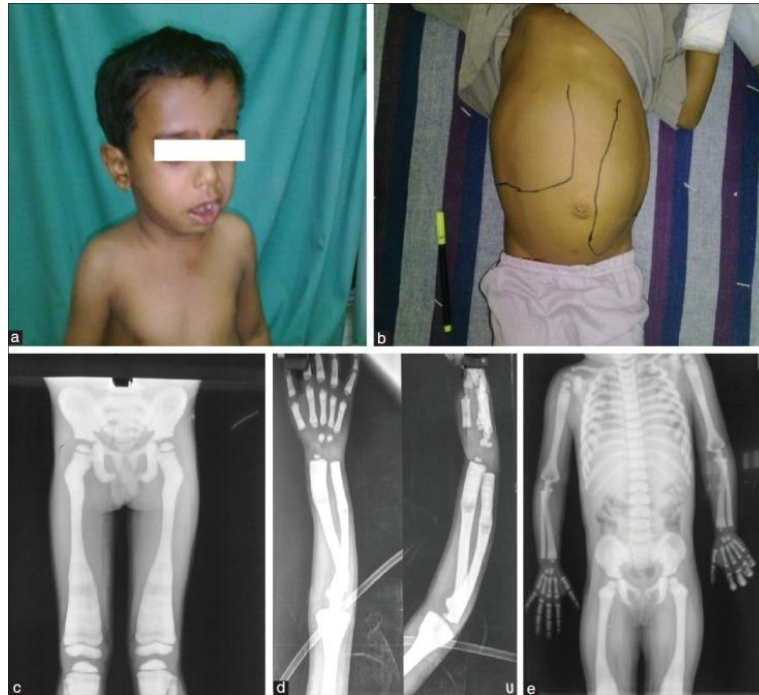
Slika 2. Osteopetroza: (a) fenotip djeteta, (b) hepatosplenomegalija, (c), (d), (e) radiogrami kostiju povećane gustoće s deformitetima (Preuzeto s:

ali narušene arhitekture što je čini podložnom prijelomima. Bolest u svom težem obliku dovodi do rapidnog sužavanja intramedularnog kanala što reducira količinu koštane srži stoga se u uznapredovalom stadiju bolesti često razviju znakovi ekstramedularne hematopoeze (hepatosplenomegalija) te znakovi leukopenije (rekurentne infekcije) i anemije (12, 14).