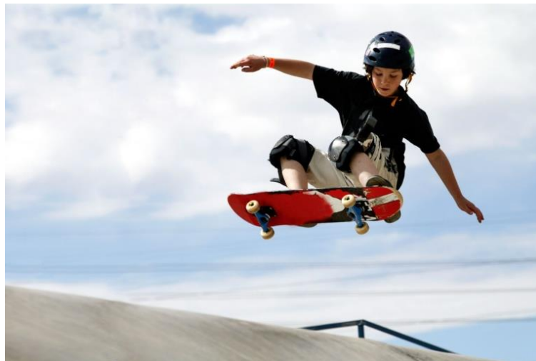
Slika 1. Najčešći uzrok prijeloma u djece su padovi prilikom igre ili sportskih aktivnosti

Prijelomi bilo koje kosti, pa tako i kostiju ruke, mogu se generalno klasificirati na spontane i patološke prijelome (6). Spontani prijelomi su daleko zastupljeniji, a u djece nastaju kao posljedica pada prilikom igre ili sportskih aktivnosti, bilo vani ili u kući (3,4,5). Nogomet, košarka ili rukomet tipični su primjeri aktivnosti prilikom kojih često dolazi do ozljeđivanja (3,4,5). Neki od prijeloma, poput prijeloma glavice i vrata radijusa, postali su učestaliji nakon porasta popularnosti skejtborda, vožnje "ATV" vozilima i drugih ekstremnijih aktivnosti (5). Padovi se također često događaju u dječjim i zabavnim parkovima (npr. skakanje na trampolinu) (3,5) ili prilikom vršnjačkog nasilja.