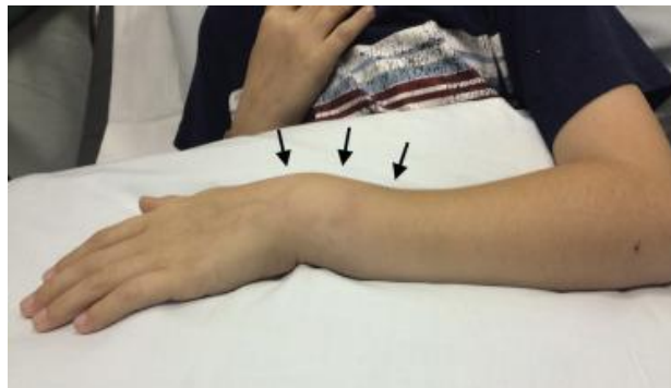
Slika 3. Bayonet ("dinner fork") deformacija kod prijeloma distalne trećine podlaktice

Kod prijeloma proksimalnog humerusa može doći do istegnuća brahijalnog pleksusa, a ukoliko je lom popraćen iščašenjem humeroglenoidalnog zgloba tada može doći i do njegove avulzije (1). Distalniji prijelomi humerusa mogu dovesti do oštećenja radijalnog živca (tok živca tik uz kost - sulcus nervi radialis ) ili arterije brahijalis (1). Suprakondilarni prijelomi, osobito ako su vezani uz prijelome u području proksimalne podlaktice, mogu dovesti do sindroma plutajućeg lakta sa razvitkom kompartment sindroma koji može izuzetno brzo kompromitirati cirkulaciju distalno (1,3-5). Ovdje se može oštetiti i ulnarni živac te strukture kubitalne jame (1).