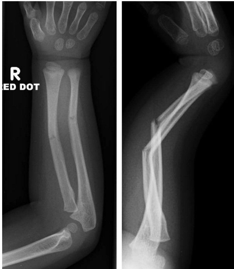
Slika 6. "Greenstick" prijelom obje kosti srednje trećine podlaktice