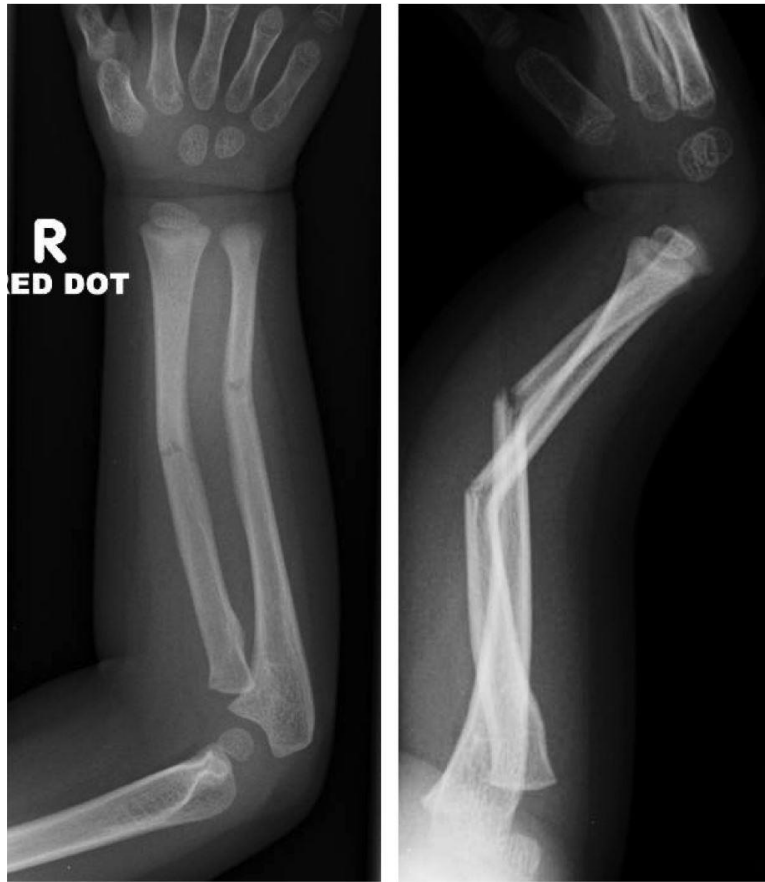
Slika 6. "Greenstick" prijelom obje kosti srednje trećine podlaktice