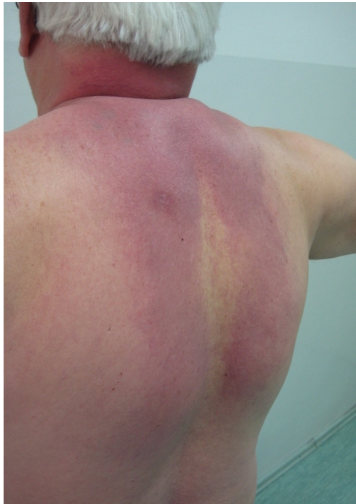
Slika 2. Scleredema diabetorum

Scleredema diabetorum je obilježen postupnom pojavom bezbolnog i simetričnog otvrdnuća i zadebljanja kože gornjeg dijela leđa i vrata uz smanjenu mogućnost stvaranja kožnih nabora (Slika 2). Promjene se mogu širiti na lice, ramena i prednji dio toraksa. Koža izgledom podsjeća na narančinu koru. Bolest se javlja kod dužeg trajanja dijabetesa u kombinaciji s pretilošću, odnosno kod tip 2 dijabetesa. Moguća patogeneza je neregulirana fibroblastična produkcija ekstracelularnog matriksa i nakupljanje glikozaminoglikana. Većina oboljelih s vremenom postaju ovisni o inzulinu, teško se liječe i razvijaju brojne komplikacije šećerne bolesti. Liječenje je uglavnom neučinkovito (10).