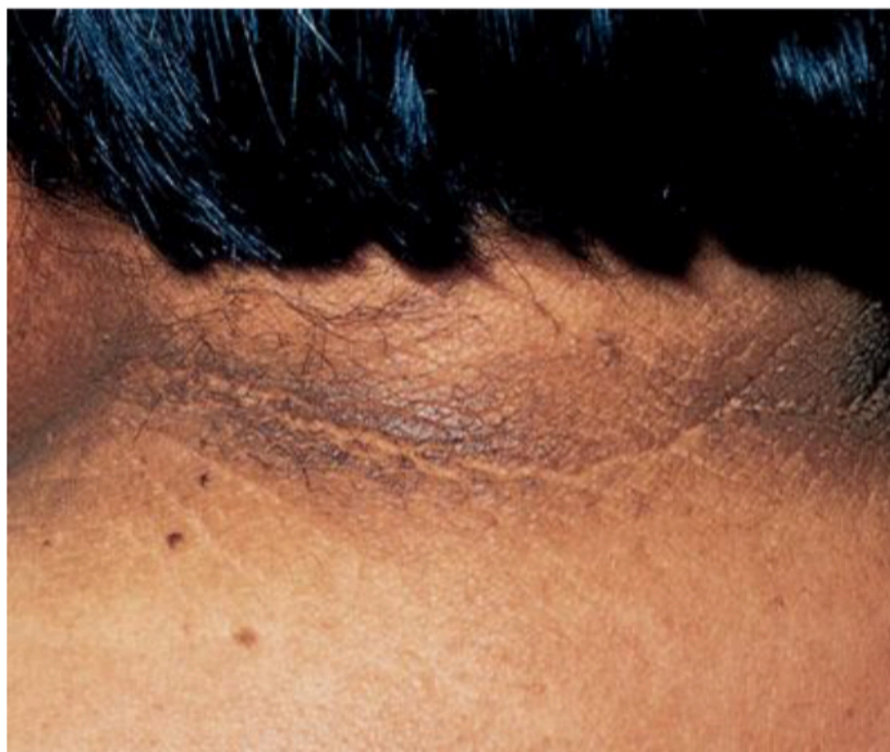
Slika 1. Acanthosis nigricans na vratu.