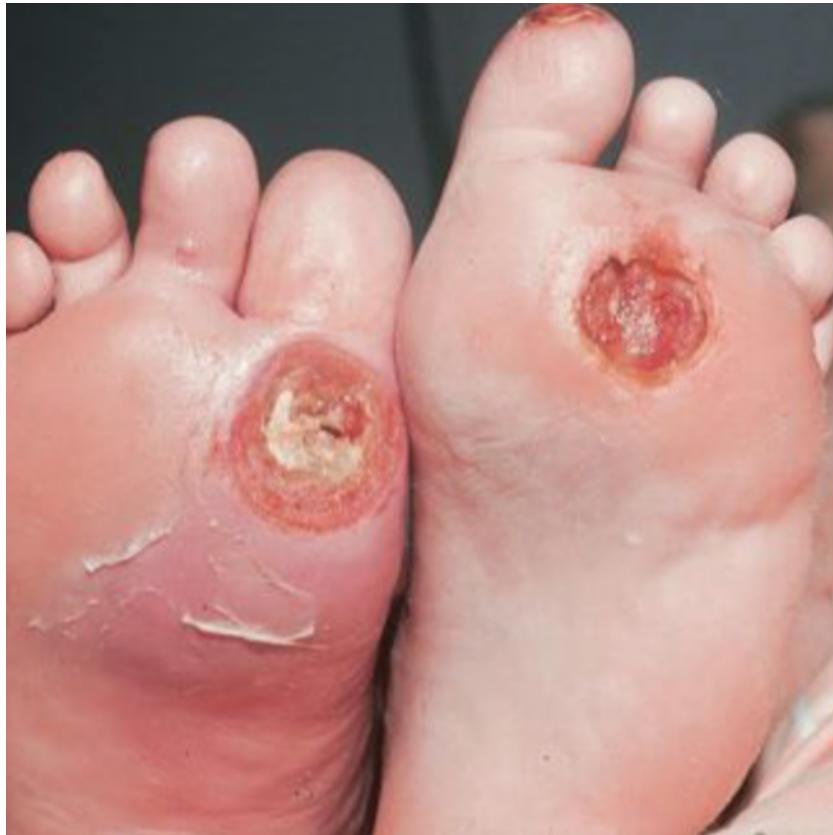
Slika 3. Dva veća ulkusa na metatarzalnim područjima stopala.

edukacije i nošenja odgovarajuće obuće, na brzom liječenju, kao i na multidisciplinarnom pristupu bolesniku. Bolesnici u slučaju izražene periferne arterijske bolesti moraju biti upućeni na kirurški rekonstruktivni ili endovaskularni zahvat radi poboljšanja ishemije stopala koja je, uz infekciju i gangrenu, najvažniji čimbenik amputacije ekstremiteta (2).