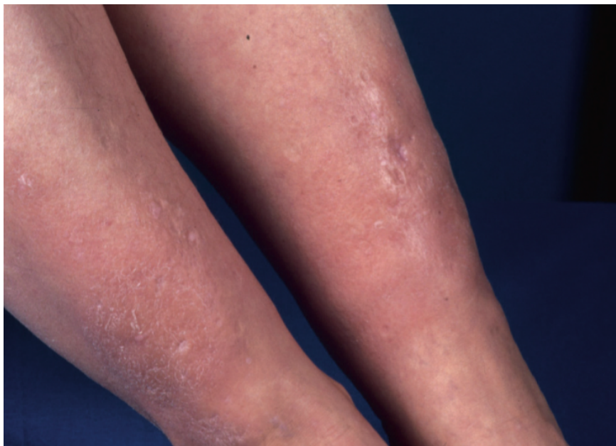
Slika 6. Tireoidna dermopatija. Suha i edematozna koža.

Učinak tireotoksikoze na razne organe također dovodi do kožnih promjena. Zbog pojačanog stvaranja kortizola javljaju se hiperpigmentacije kao u Addisonovoj bolesti. Zbog kardiovaskularnog djelovanja pojačava se dotok krvi u kožu što rezultira crvenilom lica i palmarnim eritemom. Hiperhidroza nastaje zbog ubrzanog metabolizma i disregulacije temperature (6). Također je primijećena veća učestalost kronične urtikarije u bolesnika s hipertireozom negoli u kontrolnoj skupini, međutim nije jasan uzrok (17).