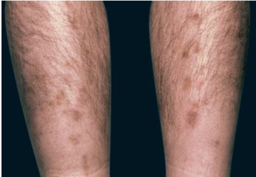
Slika 5. Dijabetička dermopatija na pretibijalnim regijama.

Izvor: Kalus AA, Chien AJ, Olerud JE. Diabetes Mellitus and Other Endocrine Diseases. Fitzpatrick's dermatology. U: Wolff K i sur., ur. Fitzpatrick's Dermatology in General Medicine. McGraw Hill Medical, 2008.