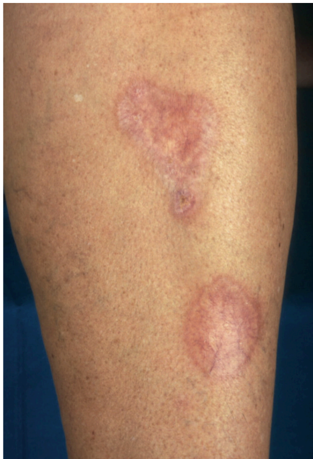
Slika 4. Necrobiosis lipoidica. Crveno-smeđi plakovi s teleangiektazijama.

Rubovi su uzdignuti i zagasito eritematozni. U početku promjene započinju u vidu crveno-smeđih papula i nodula, da bi se s vremenom izravnale, a kroz centralni atrofični žuto-narančasti dio prosijavaju teleangiektazije. Promjene se sporo razvijaju i povećavaju tijekom mjeseci ili godina. S vremenom se promjene uglavnom stabiliziraju, moguće su rijetke spontane remisije, ali i ulceracije kao najteže komplikacije. Terapija NL je nezadovoljavajuća. Moguće je liječenje kortikosteroidima pod okluzijom ili triamcinolonom intralezijski, ali naglasak bi trebao biti na prevenciji ulkusa (12,13).