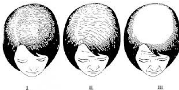
Slika 9. Podjela androgene alopecije u žena.