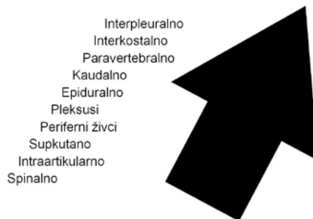
Slika 3. Poredak tjelesnih prostora prema mogućnosti brzine apsorpcije lokalnog anestetika. Spinalni prostor ima najmanju mogućnost apsorpcije, dok interpleuralni prostor ima najveću.

Prisutnost lokalnog anestetika u krvi rezultat je tkivne apsorpcije LA iz područja gdje je apliciran. Istraživanja su pokazala kako neki prostori u tijelu imaju veću, odnosno bržu mogućnost apsorpcije lokalnog anestetika u odnosu na druge (14) (Slika 3.).