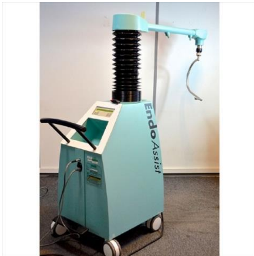
Slika 5. Endoassist robotski sustav

Sustav je razvijen u Armstrong Healthcare centru u High Wycombe, UK, također u 1990-im godinama.(slika 5.) Jako je sličan AESOP sustavu, a funkcija mu je da drži i pozicionira endoskop. Endoassist se kontrolira džojstikom ili senzorom koji se nosi na glavi. Uređaj sa trakom za glavu šalje infracrvene signale koji omogućuju Endoassist-u da prati kretanje glave kirurga. Kada kirurg pritisne nožnu papučicu, robot pomiče kameru u smjeru u kojem kirurg gleda na monitoru. Znatno je jeftiniji od AESOP sustava, ali zauzima više prostora u operacijskoj sali i rjeđe se koristi.(23)