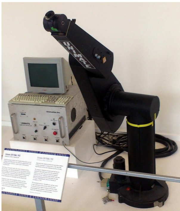
Slika 2. PUMA – Programmable Universal Machine for Assembly