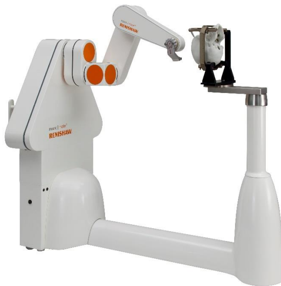
Slika 6. Reinshaw Neuromate robotski sustav

Sustav razvijen u Renishaw Mayfield SA institutu, Nyon, Švicarskoj za stereotaktične kirurške primjene.(slika 6.) Stereotaktička kirurgija je minimalno invazivni oblik kirurške intervencije koja koristi trodimenzionalni koordinatni sustav kako bi locirala ciljeve malih dimenzija unutar tijela i izvodila na njima ablacije, biopsije, implantacije, stimulacije itd.. Sustav uključuje sklop robotske ruke sa pet stupnjeva slobode kretanja i softverski sustav za kinematičko pozicioniranje na računalu. Stereotaktički rentgenski sustav pričvršćen je na operacijski stol i pruža bočne i anterioposteriorne slike za provjeru položaja elektroda za snimanje. Softver za kontrolu kintetike ruke također može identificirati i definirati zone oko glave pacijenta u kojoj smanjuje svoju brzinu zbog sigurnosti. Uveden je za upotrebu u biopsijama i postupcima aspiracije hematoma u Japanu sredinom 1990.-ih, a najnovija verzija odobrena je u lipnju 2014. godine.(24)