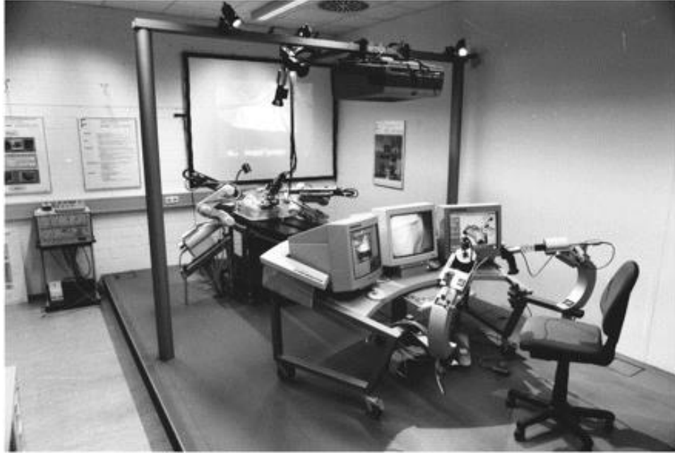
Slika 1. ARTEMIS – Advanced Robotic Telem manipulator for Minimally Invasive Surgery.