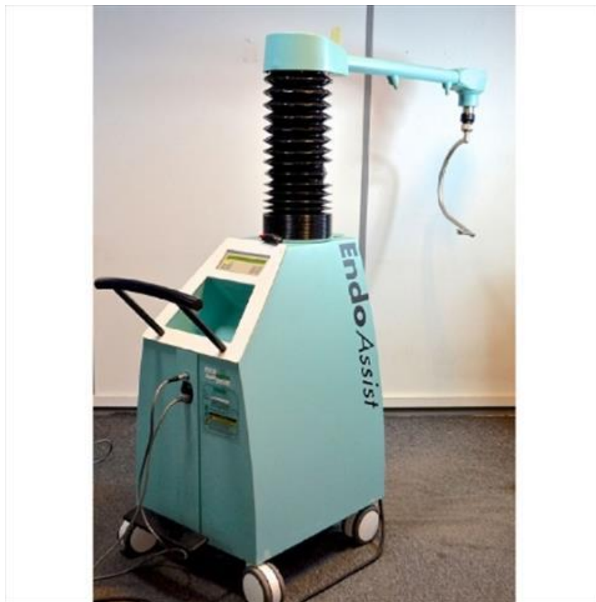
Slika 5. Endoassist robotski sustav

Sustav je razvijen u Armstrong Healthcare centru u High Wycombe, UK, također u 1990-im godinama.(slika 5.) Jako je sličan AESOP sustavu, a funkcija mu je da drži i pozicionira endoskop. Endoassist se kontrolira džojstikom ili senzorom koji se nosi na glavi. Uređaj sa trakom za glavu šalje infracrvene signale koji omogućuju Endoassist-u da prati kretanje glave kirurga. Kada kirurg pritisne nožnu papučicu, robot pomiče kameru u smjeru u kojem kirurg gleda na monitoru. Znatno je jeftiniji od AESOP sustava, ali zauzima više prostora u operacijskoj sali i rjeđe se koristi.(23)