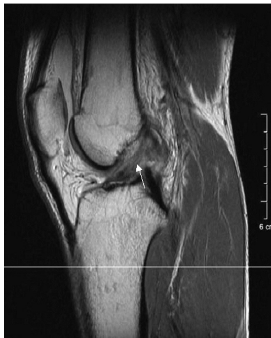
Slika 1. Strelica pokazuje kompletnu rupturu ACL-A

Slikovna dijagnostika ozljede ACL-a i okolnih struktura započinje rendgenskom snimkom koljena u AP i LL smjeru. Cilj ove pretrage je utvrditi integritet kostiju te eliminirati koštanu traumu. Na osnovu kliničke slike dijagnoza se može potvrditi magnetskom rezonancom (MR) koja je trenutni zlatni standard u dijagnostici ozljeda mekih tkiva, a osim ACL-a, ovom metodom mogu se detektirati i prateće ozljede. Za postavljanje konačne dijagnoze nije važno u kojoj je sekvenci snimka nego isključivo ravnina u kojoj se koljeno promatra. Pregled u horizontalnoj i sagitalnoj liniji najčešće ne može prikazati cijelu duljinu ligamenta, stoga je potrebno izdvojiti više vremena kako bi se snimka individualno prilagodila za pravilnu dijagnostiku (3). Dijagnostika parcijalnih ruptura ovisi o snopu koji je pretrpio oštećenje: trauma AM snopa može se utvrditi s 90 postotnom sigurnošću dok je trauma PL snopa uočljiva u 67 posto slučajeva (13).