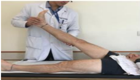
Slika 3. Lasegueov znak (12)

Lasegueov test se može kombinirati s još nekoliko testova provokacije korijena spinalnog živca. Jedan od tih testova je i „ukriženi Lasegueov znak“. Izvodi se tako da se podiže noga na strani koja nije bolna, a prilikom elevaciji bol se javlja u aficiranoj strani. Ovaj test je specifičniji za dokazivanje veće kompresije korijena ili pak centralnog prolapsa diska. Jedna od varijanti ovog testa za dokazivanje kompresije spinalnog korijena obuhvaća podizanje noge do nastajanja boli, potom se noga savija u koljenu na što se bol smanji. Ukoliko se palpira poplitealna udubina, ponovno dolazi do zatezanja ishijadičnog živca i nastanka boli (7). Ovaj test se još naziva „znak istezanja stražnjeg tibialnog živca“ (12).