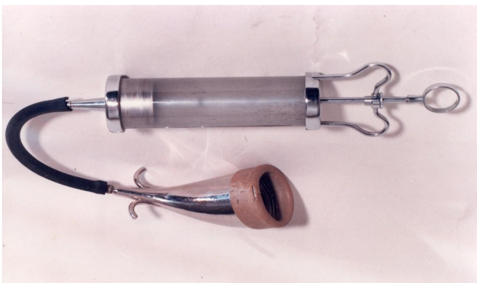
(SLIKA 2) Vakuum ekstraktor dr. Viktora Finderlea (Originalni snimak)

pacijentima. Unatoč velikom zalaganju za pacijente, perinatalni mortalitet je iznosio oko 50%. Dr. Finderle je smatrao da je to većinom uzrokovano teškim preeklampsijama i eklampsijama ili da je uzrokovano teškim porođajnim traumama uzrokovanih forcepsom. Prvi problem je pokušao riješiti tako da je uveo kratkodjelujuće barbiturate u liječenju preeklampsije i eklampsije, a drugi problem je pokušao eliminirati dizajniranjem novog instrumenta za vaginalno dovršenje poroda (SLIKA 2). Ideju je dobio sasvim slučajno dok je šetao uz more i ugledao hobotnicu. Pokušao ju je podignuti no njeni krakovi su se čvrsto zalijepili na ruku. Shvatio je da bi sličan princip mogao djelovati ako bi nešto aplicirao na glavicu djeteta i u slučaju potrebe ga ekstrahirao iz tijela majke. Isprobavao je razne materijale te je nakon 16 uspješnih poroda svoj uređaj koji je poznatiji kao „Ekstraktor 1949“ prikazao na Ginekološkoj sekciji Zbora liječnika Hrvatske ogranak Rijeka, 14.12.1950. godine (SLIKA 3). Uređaj se uskoro proširio i u ostale bolnice te je gotovo u potpunosti potisnuo forceps (7). Finderle je svojim izumom zaintrigirao i ostatak svijeta te se njegov uređaj uskoro počeo koristiti i u ostalim zemljama. Imao je vlastiti kalup po kome je mogao proizvoditi vakuum ekstraktor. Ipak, nakon odlaska dr. Finderlea iz Opće bolnice „Braća dr. Sobol“ u Rijeci, prestaje primjena i „Ekstraktora 1949, nakon što je Malmström predstavio svoj ekstraktor (8).